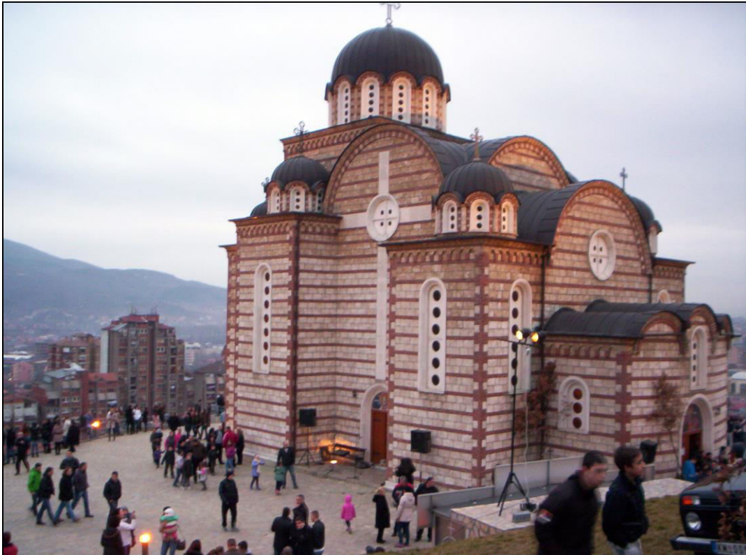
Слика 20. Окупљање грађана северне Косовске Митровице у порти Цркве св. Димитрија пред вечерњу бадњеданску литургију (фотографисано 6. јануара 2014. године).