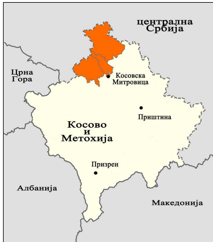
Слика 2. Положај Косовске Митровице и северног, већински српског подручја на Косову и Метохији.