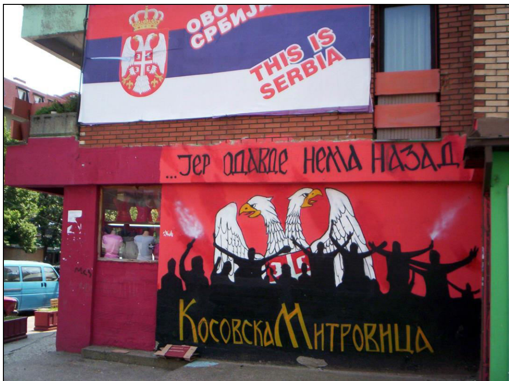
Слика 19. Мурал на зиду једне од вишеспратница на Тргу Шумадија, са српском тробојком, као означитељ српске „припадности“ северне Косовске Митровице (фотографисано 28. јула 2012. године).