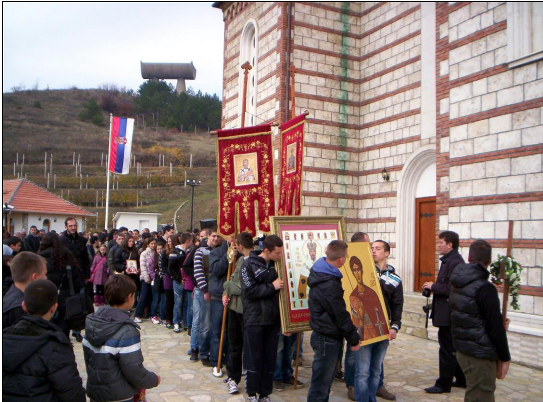
Слика 22. Формирање литије на дан градске славе Митровдана у порти Цркве св. Димитрија (фотографисано 8. новембра 2012. године).