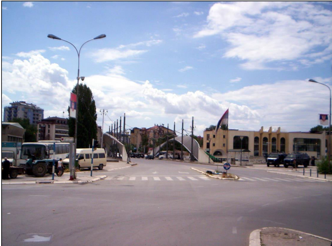
Слика 6. Главни градски мост преко реке Ибар (фотографисано 22. јула 2011. године, неколико дана уочи тзв. Јулске кризе и постављања барикада).