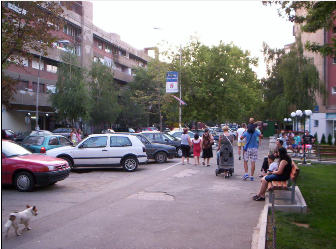
Слика 8. Улица краља Петра првог. Главна улица у северној Косовској Митровици (фотографисано 13. августа 2013. године).