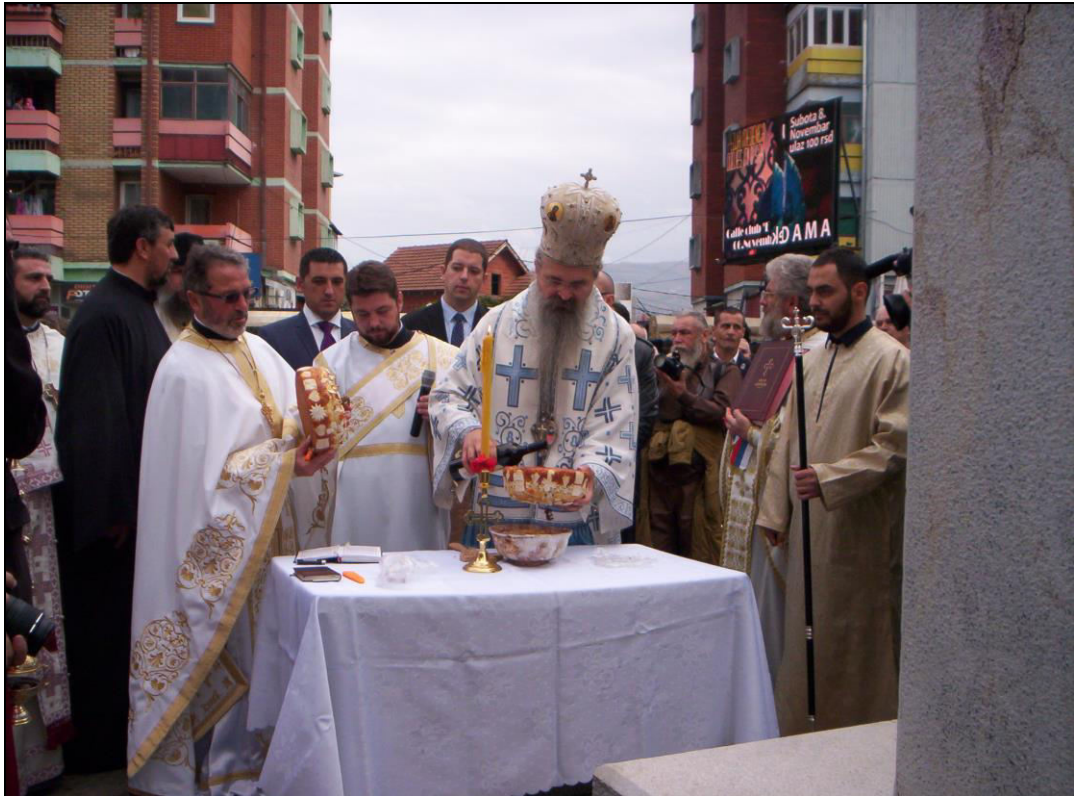
Слика 30. Обред ломљења славског колача код споменика руском конзулу Шчербини након митровданске литије (фотографисано 8. новембра 2014. године).