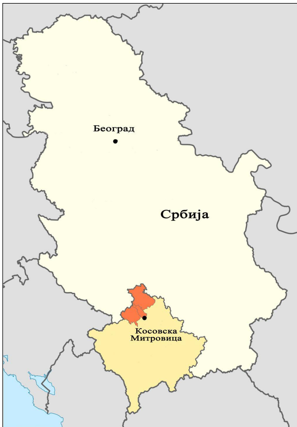
Слика 1. Положај Косовске Митровице и Косова и Метохије у Србији, са приказаном поделом овог подручја на делове јужно и северно од реке Ибар.