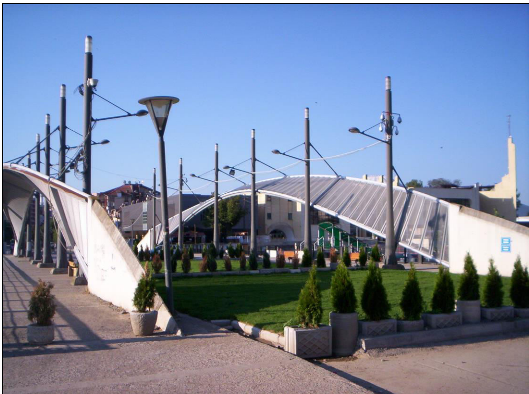
Слика 11. Тзв. Парк мира , подигнут на делу моста према северној страни Косовске Митровице (фотографисано 10. августа 2014. године).