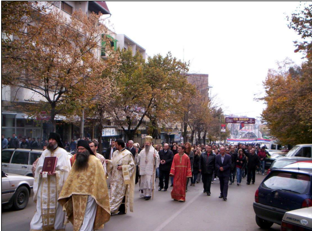
Слика 24. Кретање митровданске литије Улицом краља Петра првог, главном улицом у северној Косовској Митровици (фотографисано 8. новембра 2012. године).