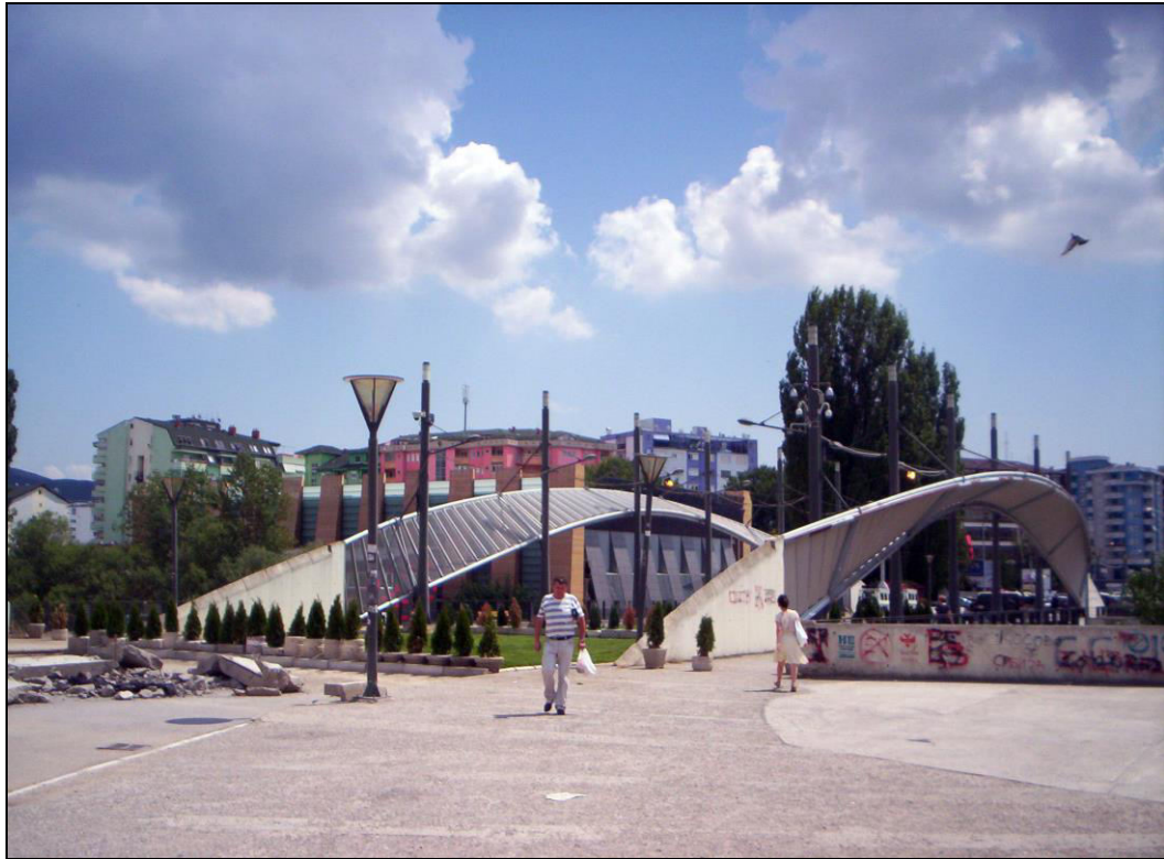
Слика 12. Свакодневица на главном градском мосту након подизања тзв. Парка мира (фотографисано 12. августа 2014. године).