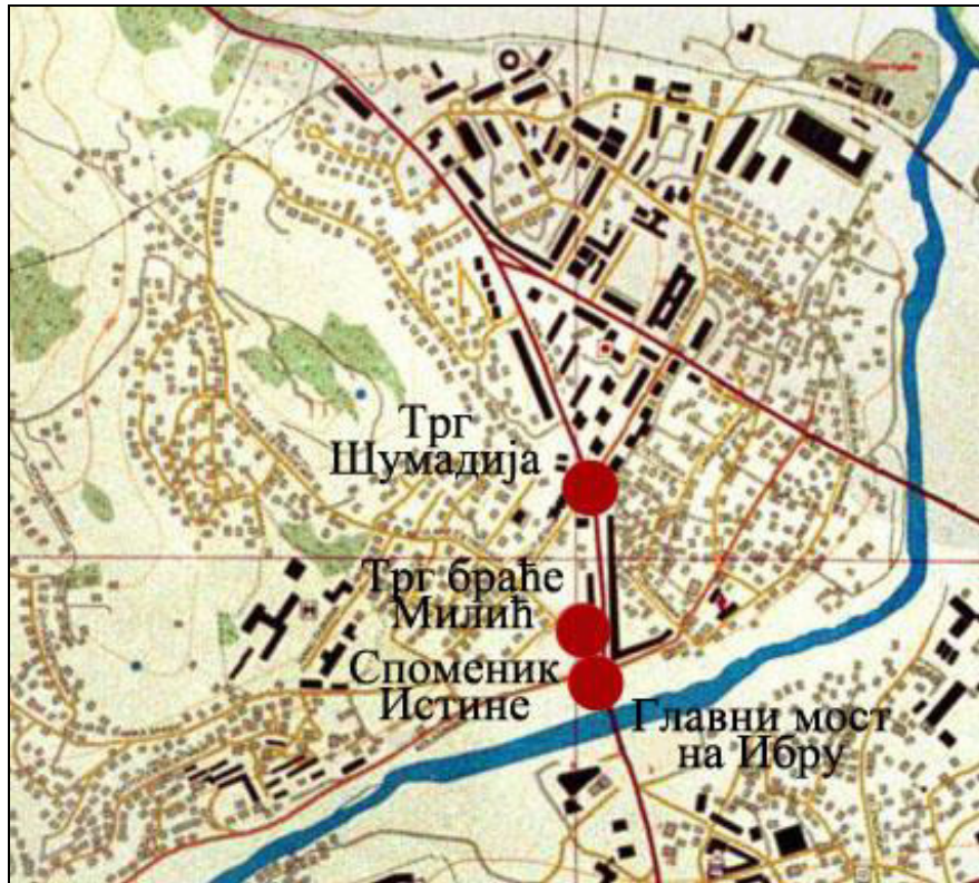
Слика 16. Распоред локација са меморабелијама као просторних маркера у северној Косовској Митровици.