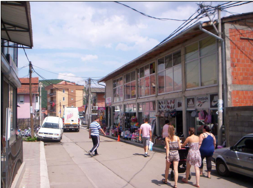
Слика 9. Улица ослобођења. Главна улица у Бошњачкој махали (фотографисано 10. августа 2014. године).