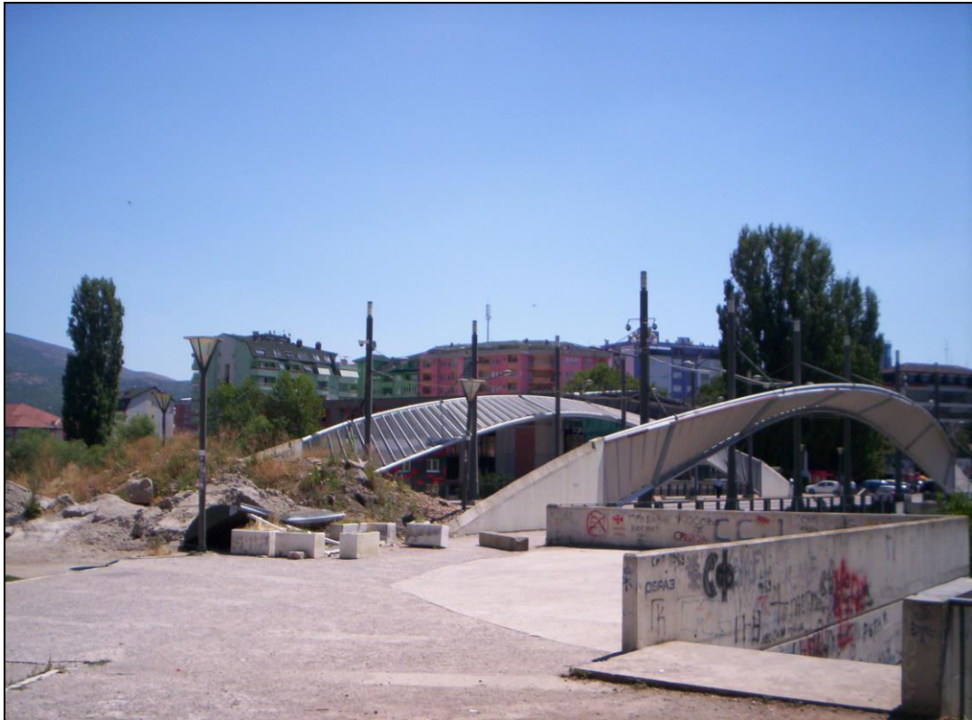
Слика 10. Барикада са северне стране главног градског моста преко Ибра (фотографисано 3. августа 2013. године).