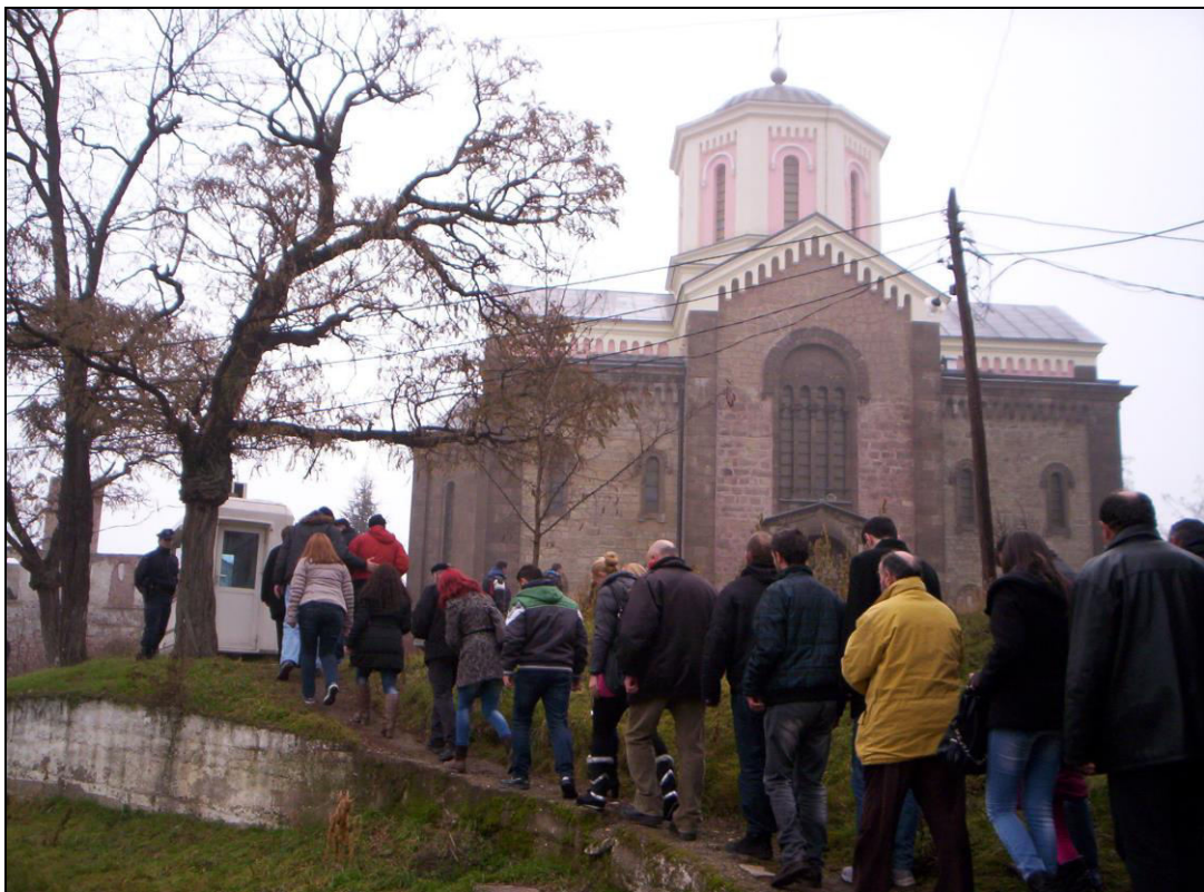
Слика 31. Колективна посета грађана северне Косовске Митровице Цркви св. Саве у јужном делу града на Божић (фотографисано 7. јануара 2014. године).