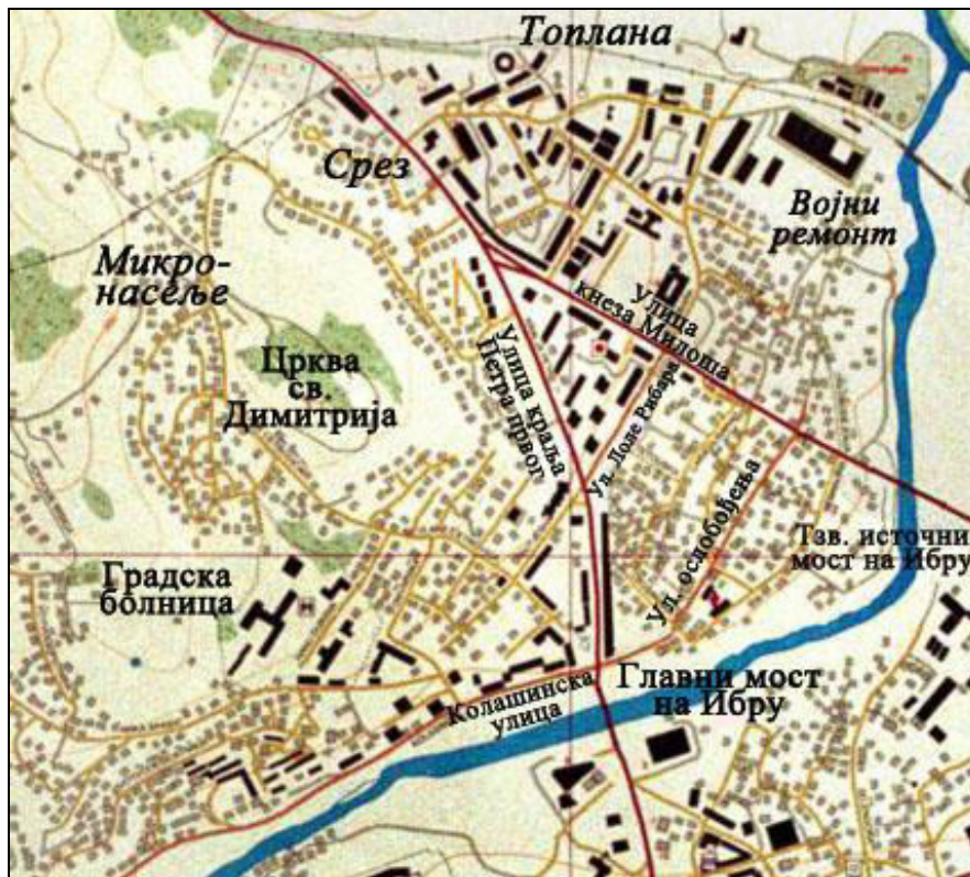
Слика 5. Топографска карта језгра северне Косовске Митровице са приказом главних граничних локалитета и неколико главних улица.