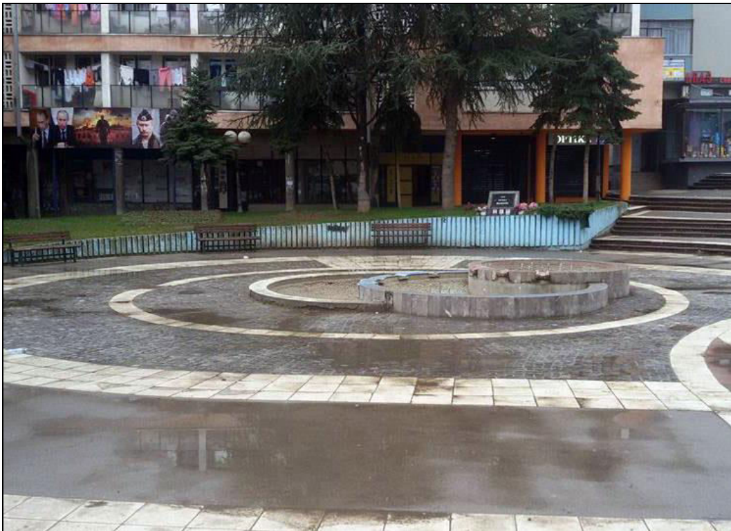
Слика 15. Трг браће Милић, назван по три брата из Косовске Митровице погинула у рату 1999. године. На тргу се налази спомен обележје постављено у знак сећања на њихово страдање (фотографисано 24. јануара 2014. године).