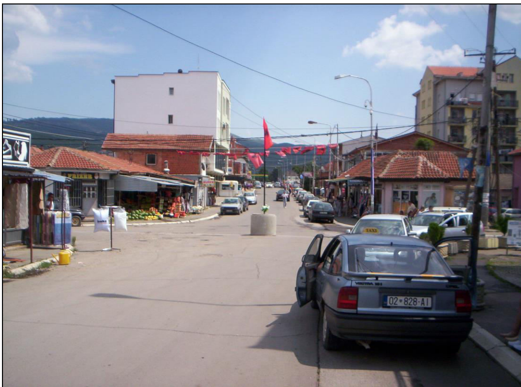
Слика 13. Импровизовано спомен обележје Адему Јашарију у Бошњачкој махали. Напред се налази тзв. источни мост којим се преко Ибра стиже у јужну Косовску Митровицу. Десно, Албанац у такси возилу са косовским таблицама очекује муштерије из северног дела града који прелазе на другу страну реке (фотографисано 12. августа 2014. године).