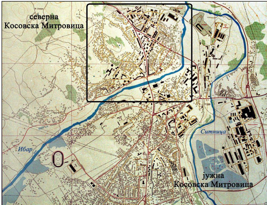
Слика 4. Приказ граница језгра северне Косовске Митровице као циљне територије истраживања.