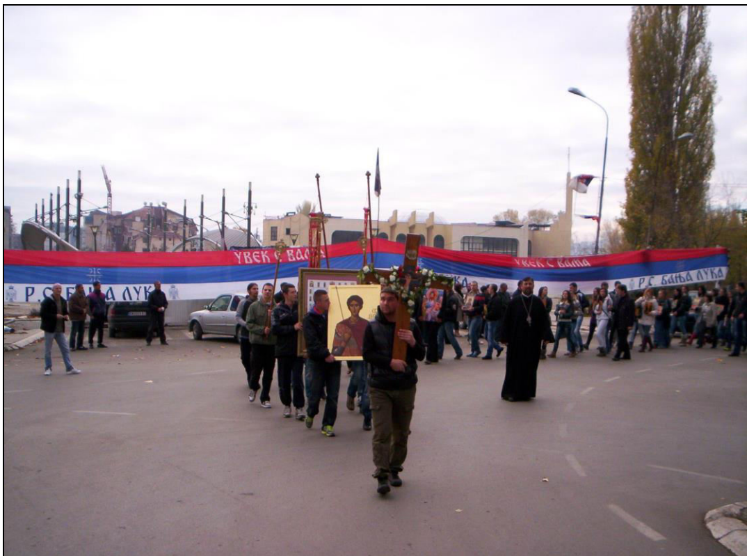
Слика 27. Долазак митровданске литије до главног градског моста преко Ибра (фотографисано 8. новембра 2012. године).