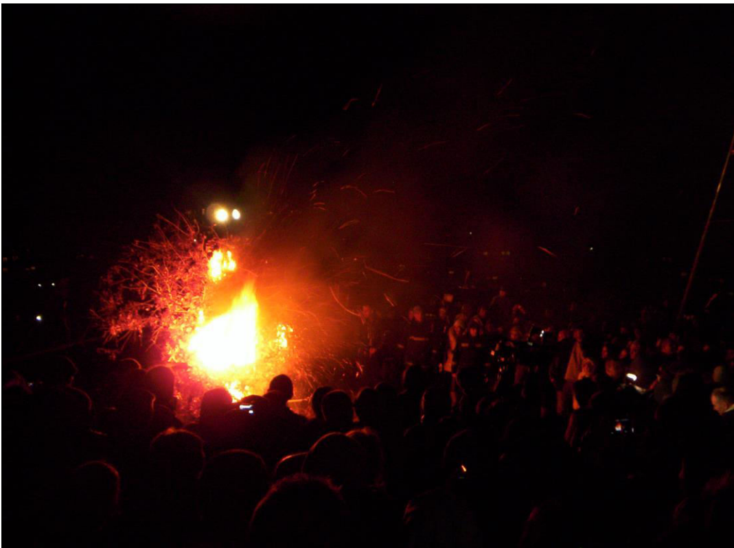
Слика 21. Налагање бадњака у порти Цркве св. Димитрија (фотографисано 6. јануара 2013. године).