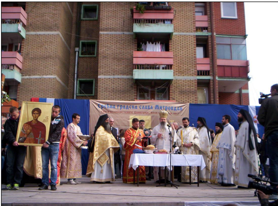
Слика 29. Обред ломљења славског колача на Тргу Шумадија након митровданске литије (фотографисано 8. новембра 2012. године).