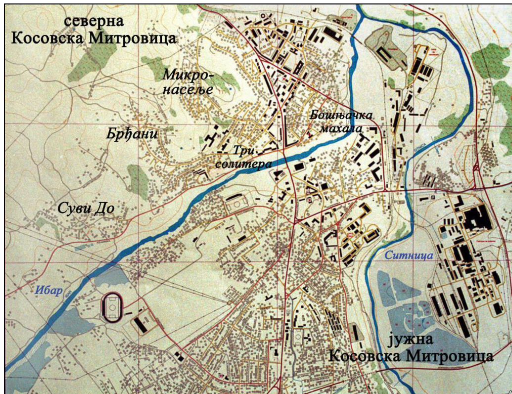
Слика 3. Топографска карта Косовске Митровице са ширим подручјем дела града северно од Ибра.