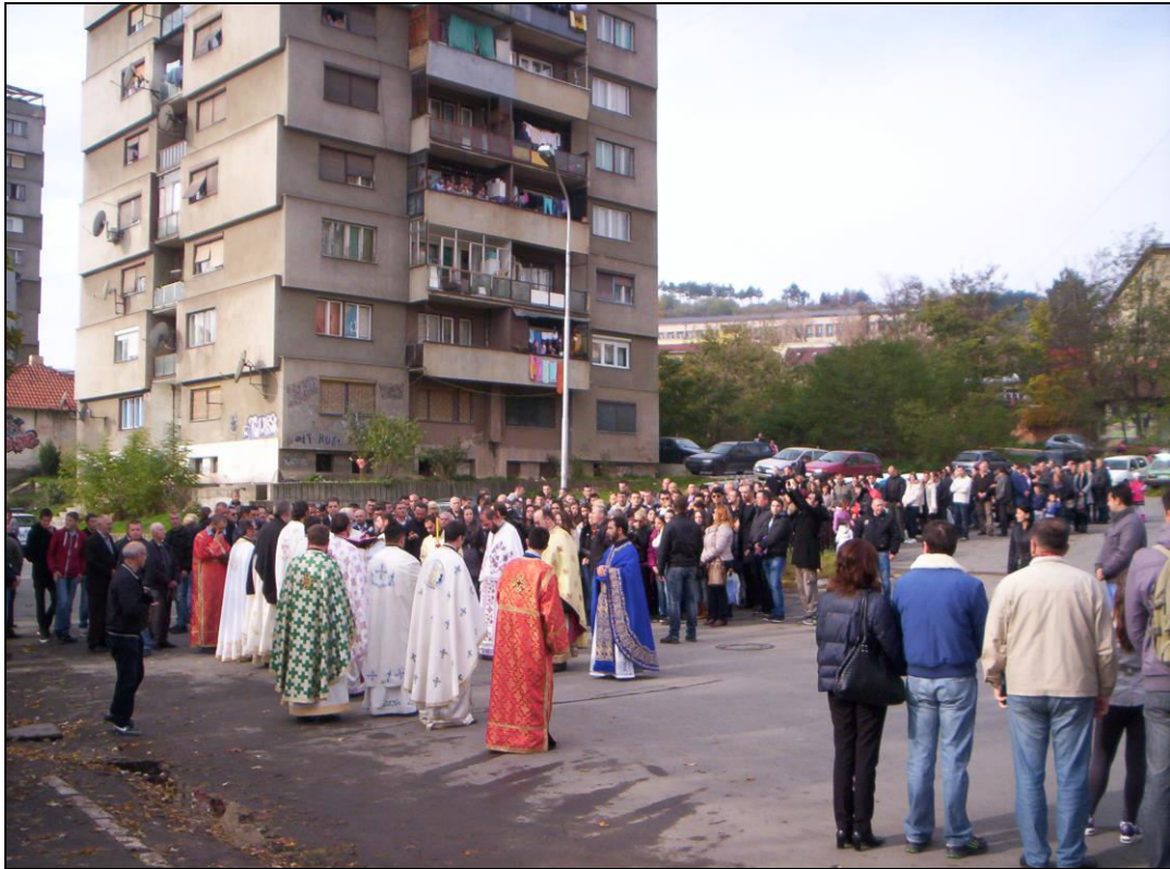
Слика 26. Зауостављање митровданске литије код етнички мешовитог кварта Три солитера (фотографисано 8. новембра 2014. године).