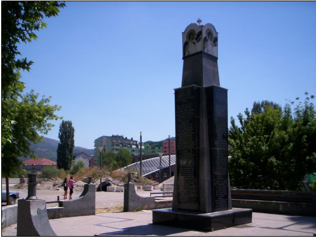
Слика 14. Споменик Истине код главног моста преко Ибра посвећен жртвама НАТО бомбардовања и погинулима у сукобима са ОВК из Косовскомитровачког округа (фотографисано 3. августа 2013. године).