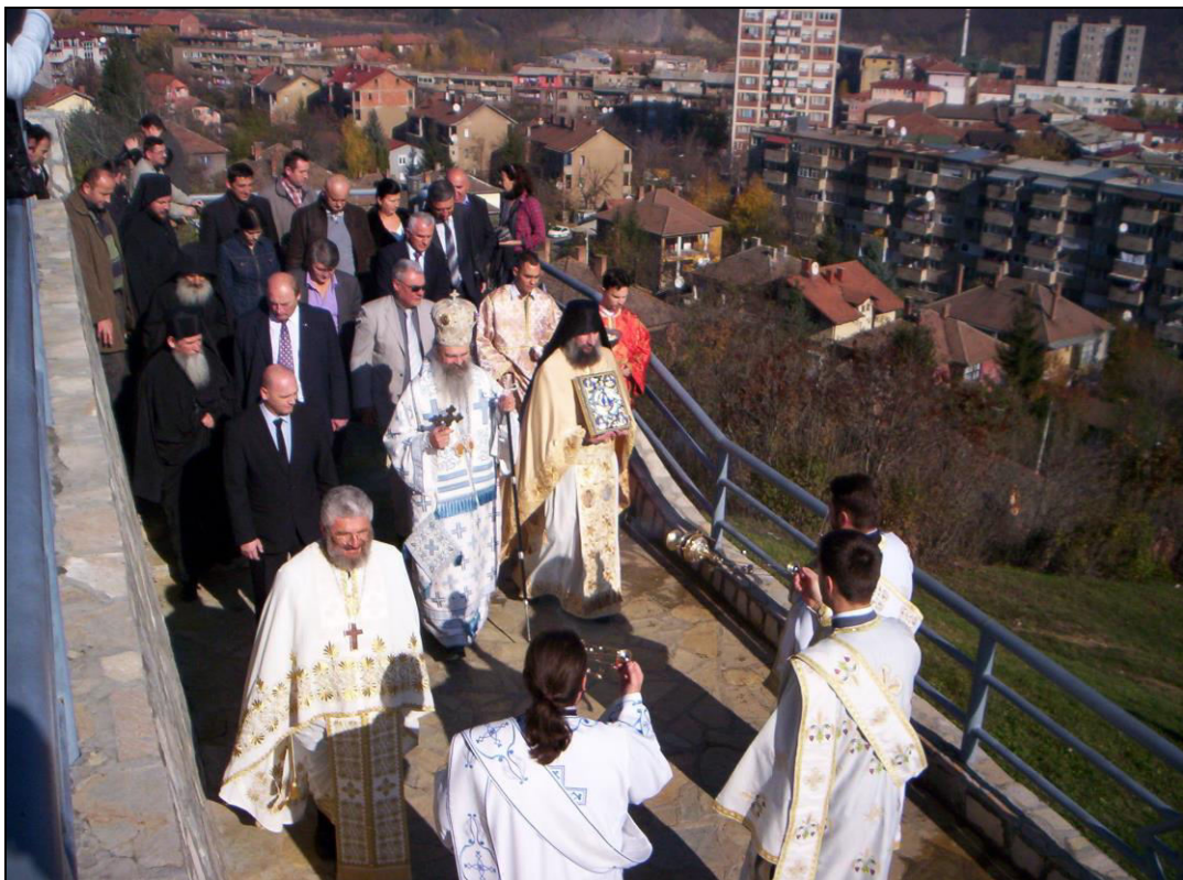
Слика 23. Полазак митровданске литије из црквене порте. Литију предводи епископ рашко-призренски Теодосије (фотографисано 8. новембра 2013. године).