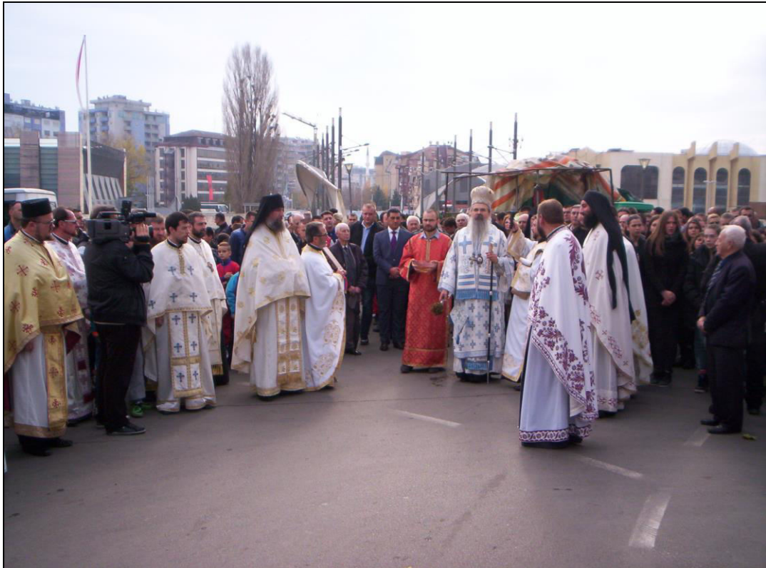
Слика 28. Зауостављање митровданске литије испред главног градског моста преко Ибра (фотографисано 8. новембра 2014. године).