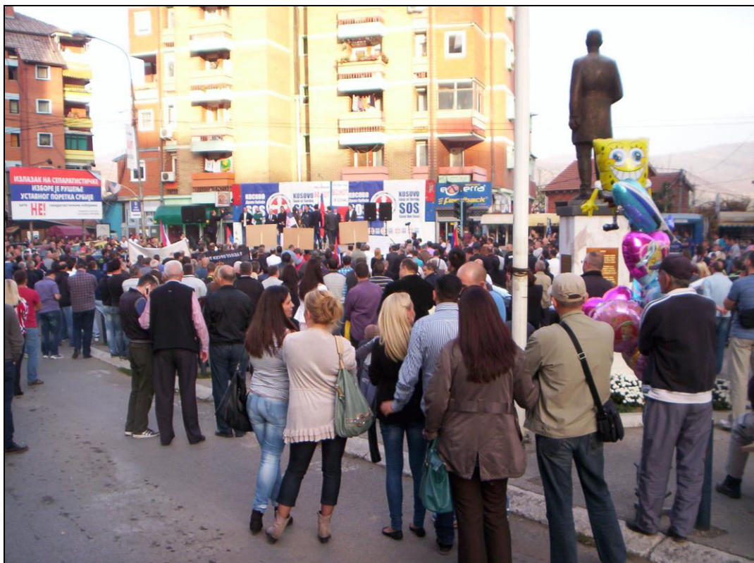
Слика 17. Трг Шумадија, са спомеником руском конзулу Шчербини, приликом скупа грађана северне Косовске Митровице против одржавања локалних избора заказаних за 3. новембар 2013. године (фотографисано 30. октобра 2013. године).