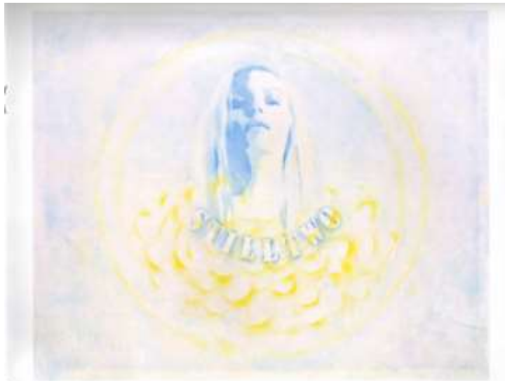
Clare, page 58 Two