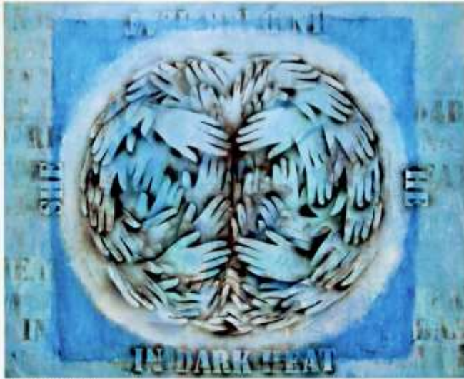
Tama Simeonovic/Dark Hour