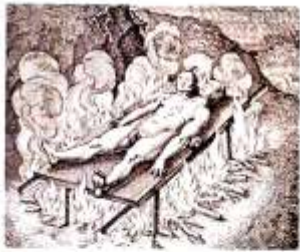
Тражи путеве (Pozvanje Puta, дигитални пројекат на полиграфском штампаном папиру, 110x90cm, 2013).