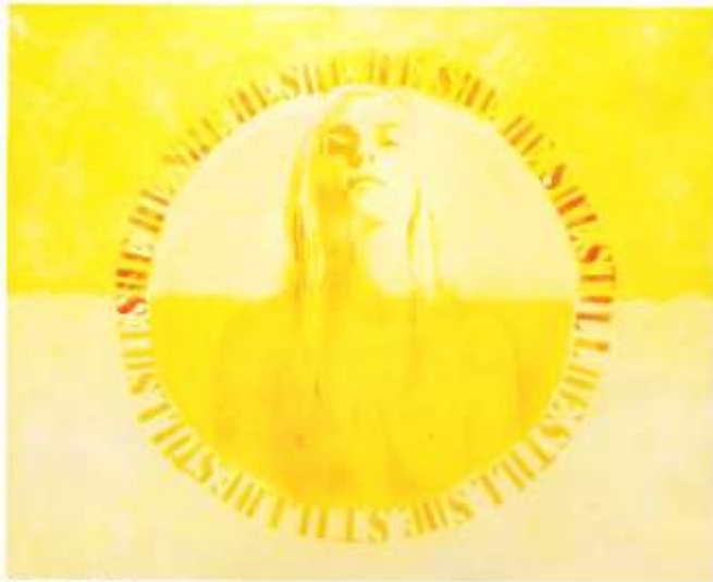
Clare, page Ten 58