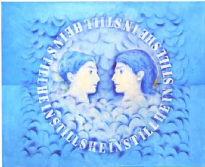
Isa yepura/S&B In