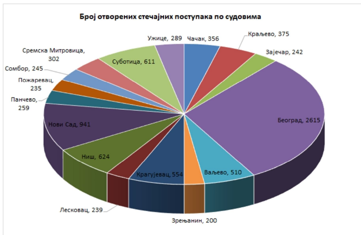
График 1. Број отворених стечајних поступака по судовима у Републици Србији

Извор: Агенција за лиценцирање стечајних управника. Статистика стечајних поступака. Доступно на: https://alsu.gov.rs/la/stecaj/statistika-stecajnih-postupaka/ (10.08.2022.)