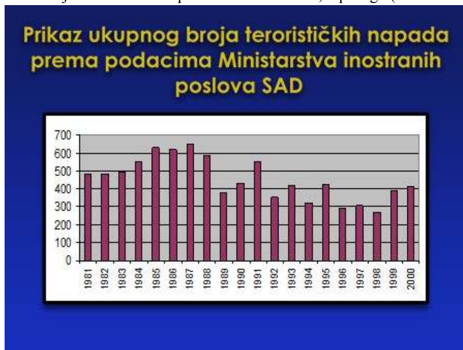
Slika - 2 201

Prikaz broja terorističkih napada i šeme Al Kaide, u prilogu (slika - 2 i 3).