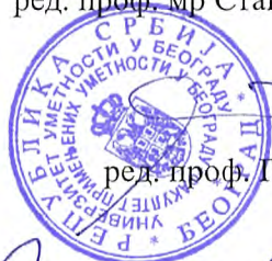
ред. проф. Горан Чајак