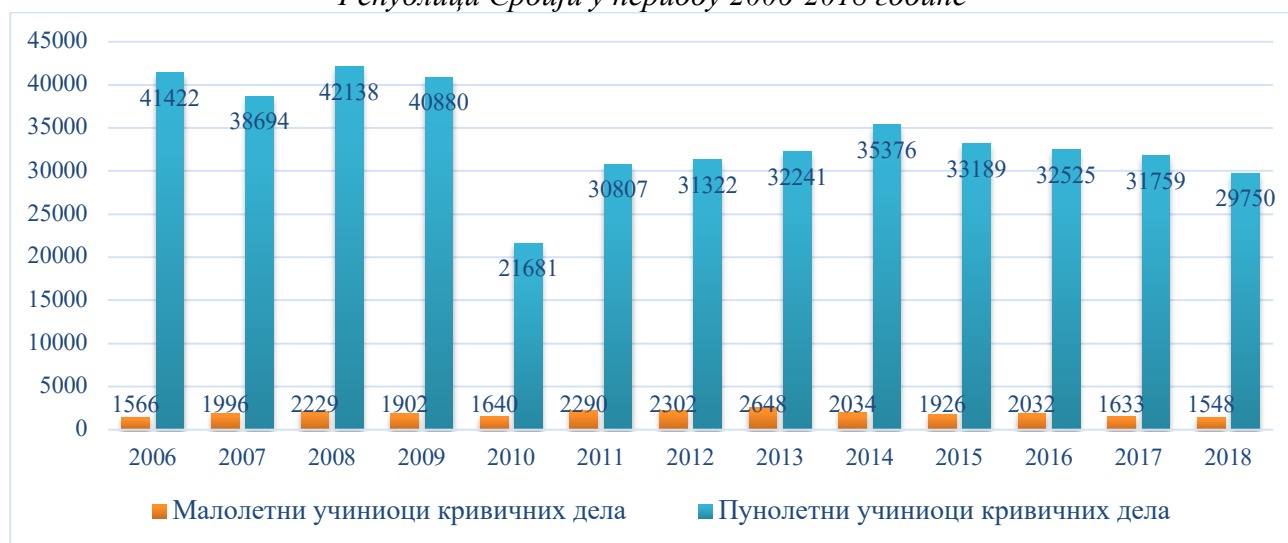
Графикон 1. Учесталост криминалитета малолетних и пунолетних лица (осуде) у Републици Србији у периоду 2006-2018 године

Учешће малолетних учиниоца кривичних дела у укупном криминалитету (малолетна и пунолетна лица) у Републици Србији (графикон 1), посматрано у тринаестогодишњем периоду (2006-2018) осцилира и креће се између 3,6% (2006.) до 7,6% (2013.) у просеку 5,5%. У последњих пет година удео малолетника је релативно стабилан и износи у просеку 5,3% (2014. 5,4%; 2015. 5,5%; 2016. 5,9%; 2017. 4,9%; 2018. 5%). Укупан број осуђених малолетних лица у посматраном периоду износи 25.746. На годишњем нивоу просечан број осуђених малолетних лица износи 1.980,5 (5,5%), а пунолетних лица 33.983,4 (94,5%).