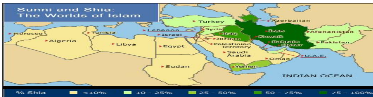
Слика 1. Заступљеност сунита и шиита на Блиском истоку и северној Африци 271

У протеклом периоду ислам је био подложен утицају марксиста и конзервативаца, а регионалне поларизације биле су идеолошки обојене. У савременом свету, религијска припадност прераста у инструмент политике и постаје везивно ткиво народа и власти. Окупљање око религијске припадности, подстицало је и поделу између муслимана. У највећој мери то се односи на Иран, као један центар шиитског ислама, и Саудијску Арабију као представника сунизма. Борба за религијски утицај који је прожет политичким мотивима, у све већој мери доводио је до нетрпељивости између Ирана и Саудијске Арабије, али и сунита и шиита широм света. С обзиром на значај региона Блиског истока, који је поприште борбе шиита и сунита, неминовно су се укључиле и регионалне и велике силе са својим супротстављеним интересима.