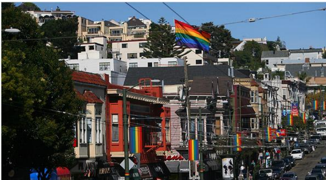
Slika 6. Kastro distrikt u San Francisku

doda i činjenica da se funkcije sadržaja u gej kvartovima prilagođavaju tržištu i zakonima profita, ekskluzivnost prostora i socijalni jaz postaju još veći. U prostoru koji se oblikuje shodno zakonima komercijalizacije bilo čega, pa i homoseksualnosti, nema mesta pravednijoj rasnoj, niti klasnoj politici.