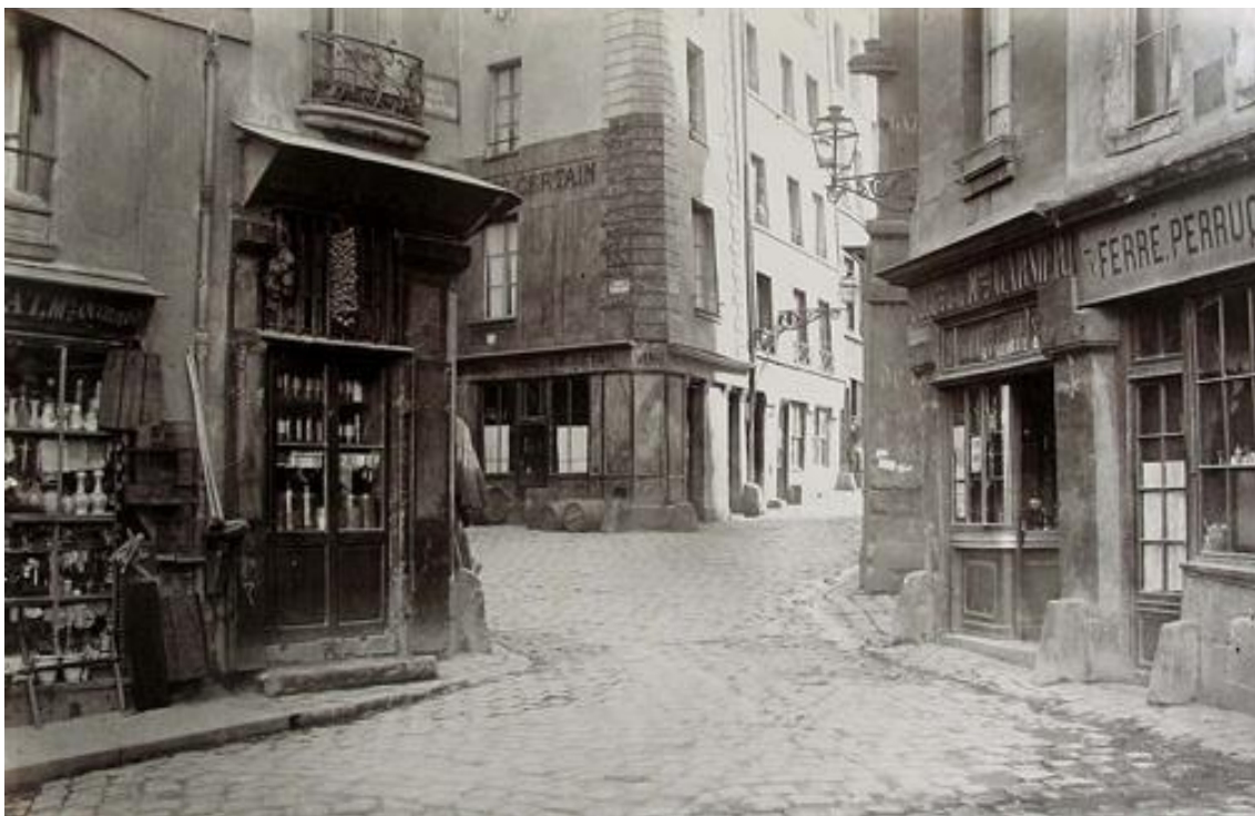
Slika 2. Izgled pariskih ulica pre Osmanove urbanističke intervencije 49 (izvor: Charles Marville)

Osim ovog događaja u istoriji Pariza, ozbiljnije pobune građana dešavale su se i tokom šezdesetih godina XX veka, a ticale se borbe protiv izgradnje nebodera, autoputeva i drugih infrastrukture čije bi postavljanje podrazumevalo rušenje tradicionalnih gradskih četvrti. Istina je, kaže Harvi, da su ljudi u Parizu tokom decenija nakon drugog svetskog rata živeli u lošim higijenskim uslovima i da se nešto po tom pitanju moralo uraditi. Problem je, međutim, u tome što je to činjeno “bez trunke demokratskog inputa ili bez milimetra žive imaginacije” (Harvi 2013: 18), pa su protesti iz '68. zahvatili, između ostalog, i ovo pitanje stavljajući ga u foliju klasne borbe.