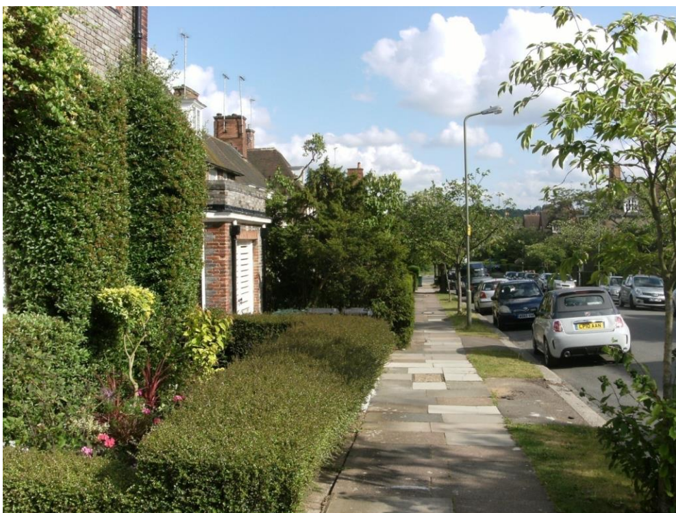
Slika 8. Vrtni grad Hempsted u Engleskoj

sedamdesetih godina XX veka podignuto je čak dvadesetak novih gradova na premisama ekologije, od kojih se mnogi i danas mogu pohvaliti kvalitetnim životom i uređenjem. Huardove ideje su se tokom XX veka raširile po SAD i Rusiji (sa katkad bezuspešnim modifikacijama), a procenjuje se da danas u svetu oko 2,6 miliona ljudi živi u oko 30 gradova koji su inspirisani Huardovom idejom vrtnog grada ( http://labourlist.org/2014/02/a-new-generation-of-new-towns-and-garden-cities/ ). 118