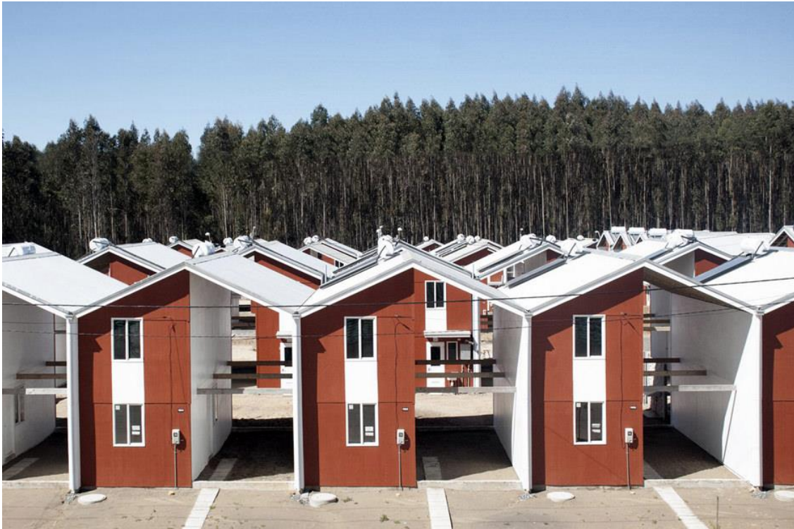
Slika 7. Projekat socijalnog stanovanja organizacije "Elemental" u gradu Konstitucion u Čileu

Pad u beskućništvo svakako može biti izazvan različitim psihološkim i socijalnim situacijama, a Španija predstavlja interesantan primer paradoksa i porasta broja beskućnika poslednjih godina. Preciznije, u Španiji trenutno postoji oko 3,4 miliona praznih stanova, dok istovremeno u proseku oko 100 ljudi dnevno pada u beskućništvo zbog nemogućnosti otplate bankovnog kredita. 113 Reagujući na takve nepravde, organizacija La PAH 114 krenula je u ozbiljne akcije zaštite prava na stanovanje i upornošću uspela da spreči oko 1600 iseljenja, i to ne trenutno, već trajno putem pregovora aktivista, dužnika i banke. Neke banke su na kraju čak dozvolile da se dužnici usele u stanove čiji su vlasnici same banke, kao i da se otplata nadalje vrši u vidu neke vrste socijalne rente. Takođe treba pomenuti i to da, pošto za problem građana nije bilo razumevanja na nacionalnim instancama,