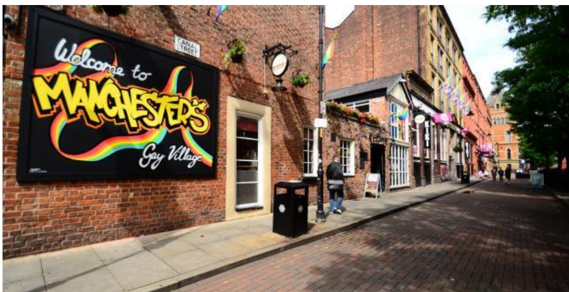
Slika 5. Mančesterski gej kvart

identitetskog izdvajanja posebno nailazila na zid u francuskom društvu, u čemu i leži jedno od objašnjenja zašto ovde nije prisutan veći broj gej getoa, odnosno zašto oni nisu toliko raširena pojava kao u Severnoj Americi. Posebno je napadan Mare geto u Parizu, pri čemu akteri osude nisu bili samo stanovnici susedstva koji su se žalili na buku, već i akademska zajednica i intelektualci koji su u formiranju getoa videli pretnju za francuski republikanski građanski identitet i nacionalnu solidarnost. U francuskoj političkoj kulturi dominira univerzalističko shvatanje po kome svi ljudi bez obzira na razlike (seksualne, rasne, klasne, religijske itd.) treba da žive zajedno i kao građani uživaju jednaka prava. LGBT zajednica okupljena oko Mare kvarta, nasuprot tome, sebe je izdvojila od većine, demonstrirajući time da ne želi da se uklopi u celinu društva (kako su tamošnji kritičari to ocenjivali). Time je Mare geto optuživan za preuzimanje SAD modela političke kulture građanstva, gde mikro zajednice traže svoja posebna prava, što na kraju pretilo da rezultuje fragmentacijom nasuprot čvrsto integrisanom društvu (Sibalis 2004: 1753). 101