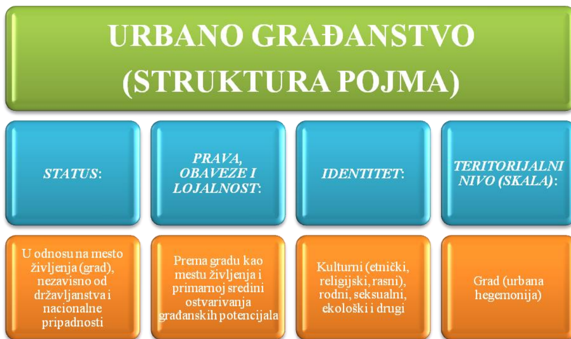
Slika 4. Struktura pojma urbano građanstvo