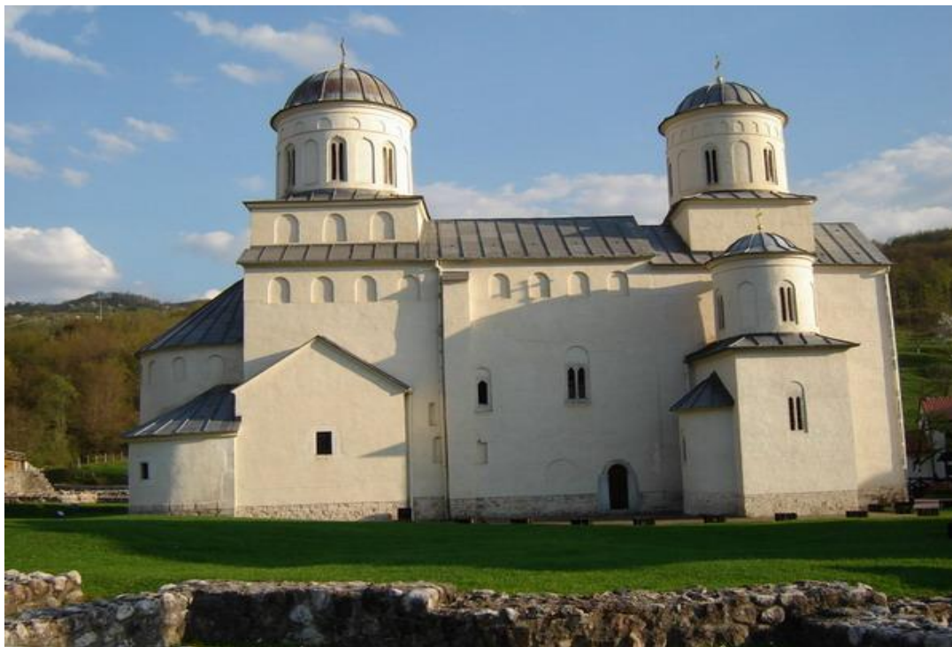
Слика број 7: Манастир Милешева

китор. Манастир се помиње у Студеничком типичу 1207–1215. године. Одлуком првог архиепископа Саве Немањића и краља Стефана Првовјенчаног да манастир Св. Николе постане катедрални храм за Дабарску епископију још више је истакнут његов углед и значај. 501