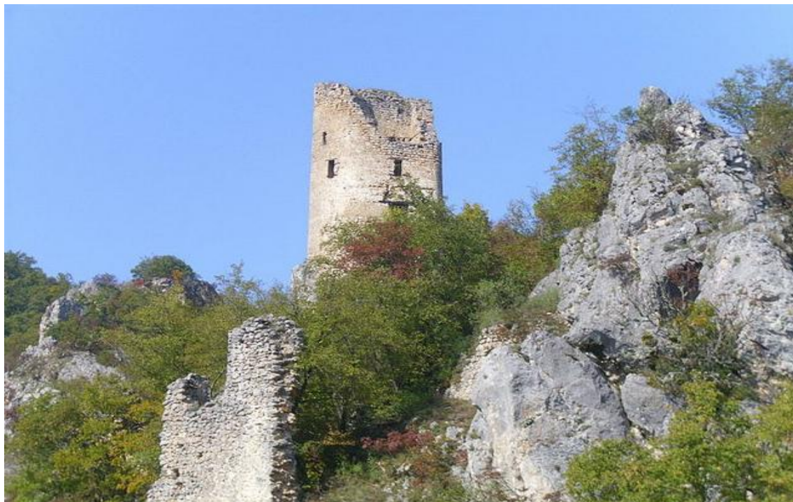
Слика број 5: Град Самобор

У Самобору је често боравио Сандаљ Хранић, а касније је Самобор постао један од главних градова херцеговог Подриња. У једном дубровачком извору из 1423. године помиње се град и његово подграђе ( soto Samobor ). 374