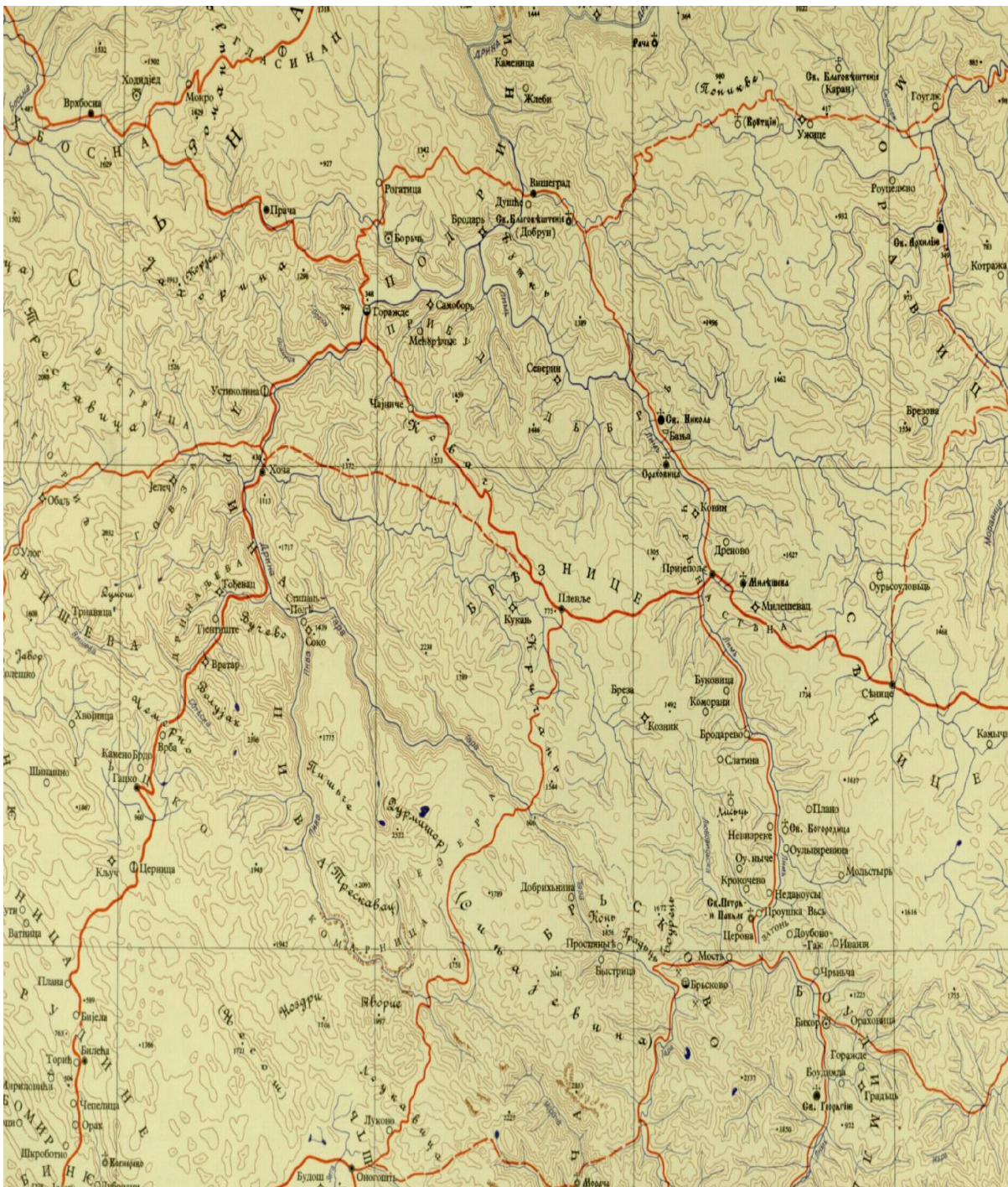
Карта број 2: Путне станице у Средњем и Доњем Полимљу и Горњем Подрињу 865