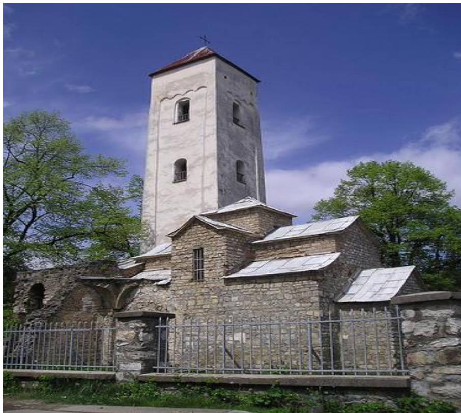
Слика број 1: Манастир Светог Петра и Павла