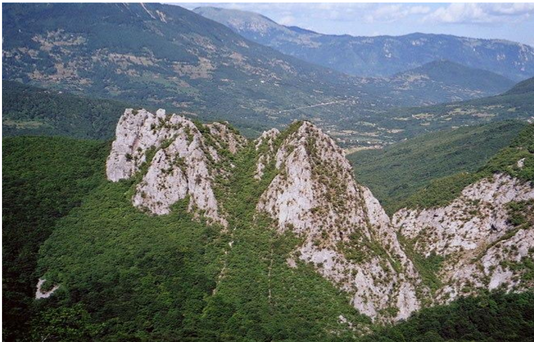
Слика број 3: Град Тођевац, камени стражар на Хрчавки

Градина (870 m) изнад лијеве обале рјечице Хрчавке, лијеве притоке Сутјеске, у подножју планине Тођевац. Зато се у научној литератури ова жупа поуздано смјешта око града Тођеваца. У граду се налазила резиденција Стефана Вукчића Косаче, што му је потврђено повељама из 1444. 1448. и 1454. године. 164