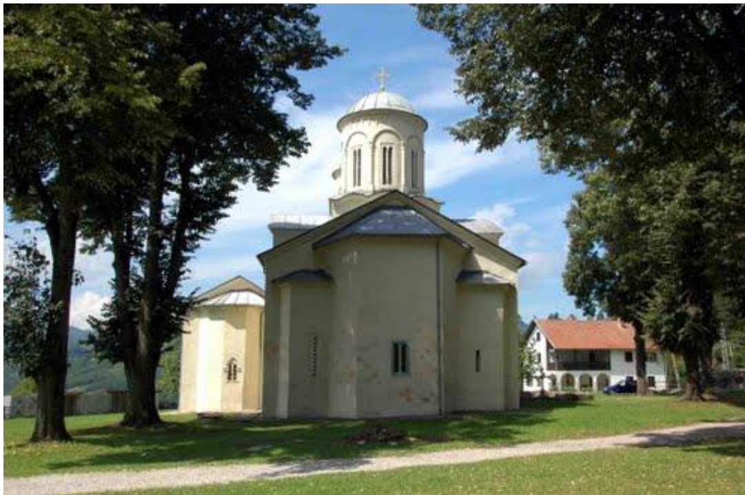
Слика број 8: Манастир Светог Николе у Бањи

У једној биљешци из Дубровачког архива сазнајемо да је Бања 1405. године била у власти кнеза Павла Раденовића. 602 Међутим, до нове територијалне промјене дошло је исте године у корист Србије. Према уговору од 18. јула 1405. године наводи се јасна одредница припадности Бање ad partes Sclavoniae in loco vocato ecclesia S. Nicolay. 603