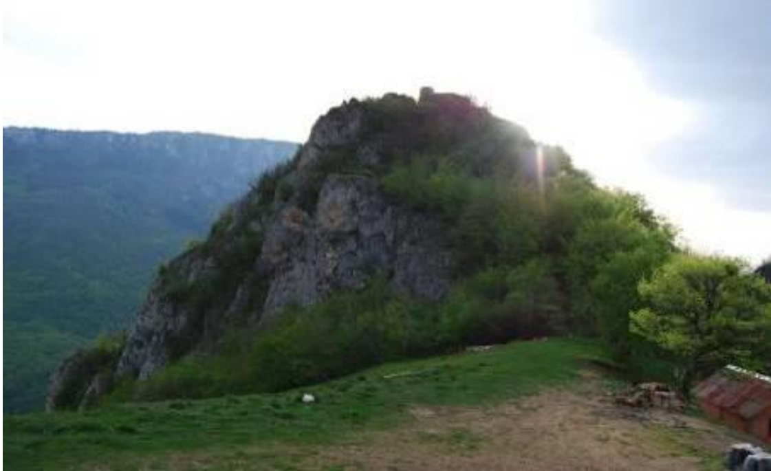
Слика број 2: Соко град изнад Шћепан Поља

Жупску организацију у „земљи“ Дрини није могуће у потпуности реконструисати због недостатка изворне грађе. Сутјеска је позната из дубровачке архивске грађе. Простирала се у поречју Сутјеске, лијеве притоке Дрине, између Волујка и Маглића, на истоку, и Зеленгоре и Трескавице, на западу. Налазила се на путу који је из Дубровника ишао на Требиње, Билећу, Гацко, затим се спуштао у тјеснац ријеке Сутјеске. Излазећи из клисуре доспијевао је у Тјентиште, пут је даље водио за Горње Подриње. Према подацима из Дубровачког архива у прољеће 1435. године караван са сребром дубровачких трговаца, који је долазио из Сребрнице, претрпио је разбојништво in loco vocato Sutjeska . Тврђава Вратар штитила је улаз у тјеснац ријеке Сутјеске. Ту је војвода Стефан Вукчић успоставио царину ( in Sutischa , 12. VI 1436), па су му Дубровчани упутили жалбу. Вратар у Сутјесци у историјским изворима помиње се 1444 ( Vatrato Sucisti, castelo con lo contato ), 1448 ( castrum Bratel