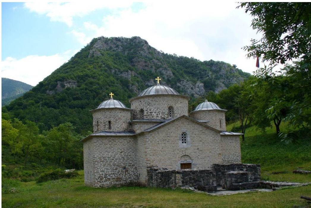
Слика број 6: Манастир Давидовица

Дубровачког архива сазнајемо да је жупан Димитрије–Давид имао депозит од 2.300 перпера, а његови новчани уноси у дубровачку благајну и подизања средстава, указују нам да је био богат човјек, високог рода са великим повјерењем у Дубровнику. 497