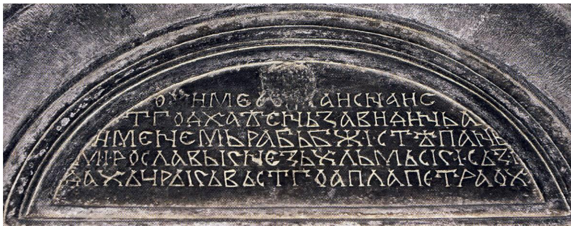
Слика број 4: Ктиторски натпис кнеза Мирослава (око 1190. године)

Цркву Св. Апостола Петра на Лиму, подигао је велики кнез Мирослав. Постоји мишљење да је била сазидана до 1190. године, 259 али такође и мишљење да је подигнута између 1195. и 1199. године. 260 Црква је сигурно настала до 1199. године, јер тада Мирослав није више био жив. 261 У познијим родословима и летописима погрешно је навођено да је ктитор цркве Св. Петра Завида, за кога се сматрало да је брат Стефана Немање. 262 Ова непознаница разријешена је на основу оштећеног натписа уклесаног у тимпану главног портала.