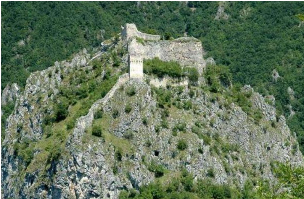
Слика број 9: Град Милешевац

Послије обнављања Деспотовине (1444) наступио је период новог успона, с тим што српска Деспотовина није могла обновити јачину државе коју је раније имала. Област Горњег и дио Средњег Полимља, па и читава област Бранковића, остала је и даље под посебним режимом према Османлијама. У октобру 1444. Стефан Вукчић је вратио Деспотовини Горњу Зету са утврђењима Соко и Медун и са деспотом је склопио савез. 639