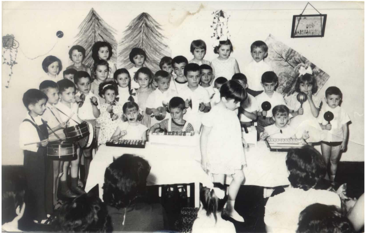
(Sa priredbe na kraju školske godine, Dečiji vrtić u Kikindi, 1966.)