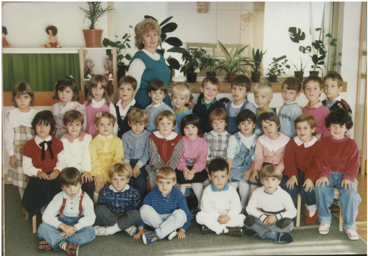
Dečijem vrtić “Plavi čuperak”, Kikinda, 1988.godine