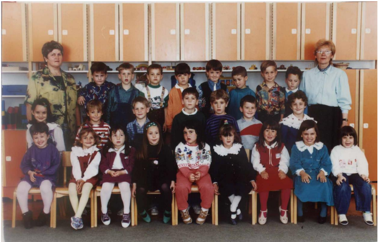
Vaspitna grupa dečijeg vrtića «Plavi čuperak», Kikinda, 1996.