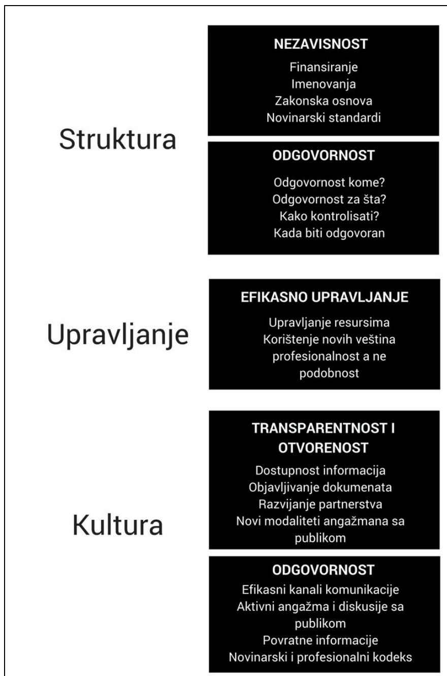
Grafik 1: Tri nivoa organizacionog modela javnih servisa