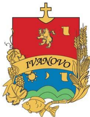
Slika 6. Grb Ivanova 40