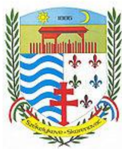
Slika 4. Grb Skorenovca 34

Šebešćen ističe da su se doseljenici zbog čestih poplava i otežanih uslova za rad, nakon četiri godine, 1887. odlučili da se iz Đurđeva presele u Skorenovac. Skorenovac je u Srbiji najjužnije mesto sa većinskim mađarskim življem. Prvi pisani dokument koji pominje naselje pod imenom terra Zkronovecz, potiče iz 1412. godine, a već 1428. kao villa regalis (kraljevsko dobro) kada kralj Žigmond (Sigismund von Luxemburg) daruje privilegije gradu Kovinu u vidu dva obližnja sela: Bavanište i Skorenovac (Sebestyén 2008: 113). Autori navode da su Sekelji ovde kolonizovani 1882-83, na nekadašnju vojnu granicu Đurđevo, tada već delimično napušteno mesto, koje se nalazilo na plavnom području sa još neizgrađenim branama (Péter 2008: 33, Szabadka1936: 5). Kako Peter ističe „pre Sekelja, meštani su ovde živeli u krajnjem siromaštvu, u starim,