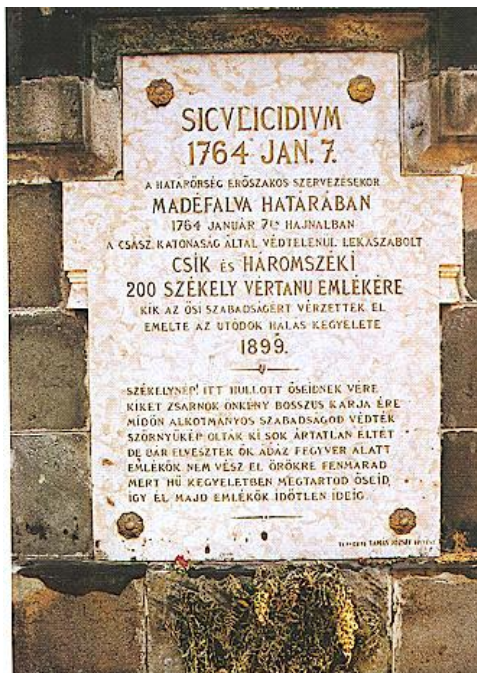
Slika 1. Spomen ploča čuva uspomenu na stradanja Sekelja kod Madefalve. 27

Šebešćen dalje ističe da su se meštani, ne sluteći tragičan preokret, povukli u miru u nadi da će sledećeg dana izaći pred komisiju sa molbom. Međutim, u zoru ih je „umesto crkvenog zvona, probudila buka topova, vođe su uzalud držale marame koje su se vijorile, ipak su postale žrtve pokolja dok je vojska palila selo. Narod se razbežao iz sela koje je gorelo u plamenu, bežali su gde su stigli [...]. Mnogi su se utopili u reci Olt, dok su ostali podlegli ranama i stradali u šumama. Sakupljen narod nije imao lošu nameru, već je samo želeo da reši svoje pitanje. To dokazuje i činjenica da se Sekelji nisu ni branili, a imali su oružje i bili su u većem broju od vojnika“ (Sebestyén 2008: 6).