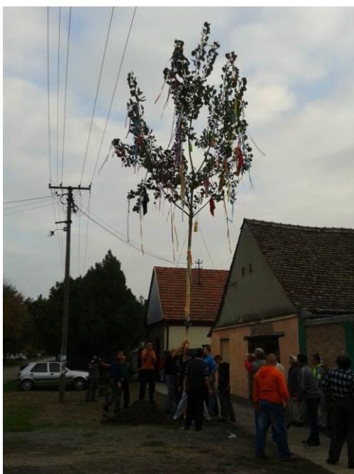
Slika 7. Kirvaj u Vojlovici: podizanje stabla topole.

Proslava Kirvaj (Kirváj) obeležava se u Vojlovici, a počinje dizanjem okićenog drveta. Dan pre praznika, skupina muškaraca donosi stablo topole iz šume, sledećeg dana prolaze kroz selo u svečanoj procesiji sa topolom na ramenu i podižu ga ispred KUD-a, gde stoji nedelju dana. Drvo se kiti šarenim vrpčama, crvenim jabukama i flašama crnog vina. Kirvaj se slavi dva dana, poslednjeg vikenda u septembru. Ovaj