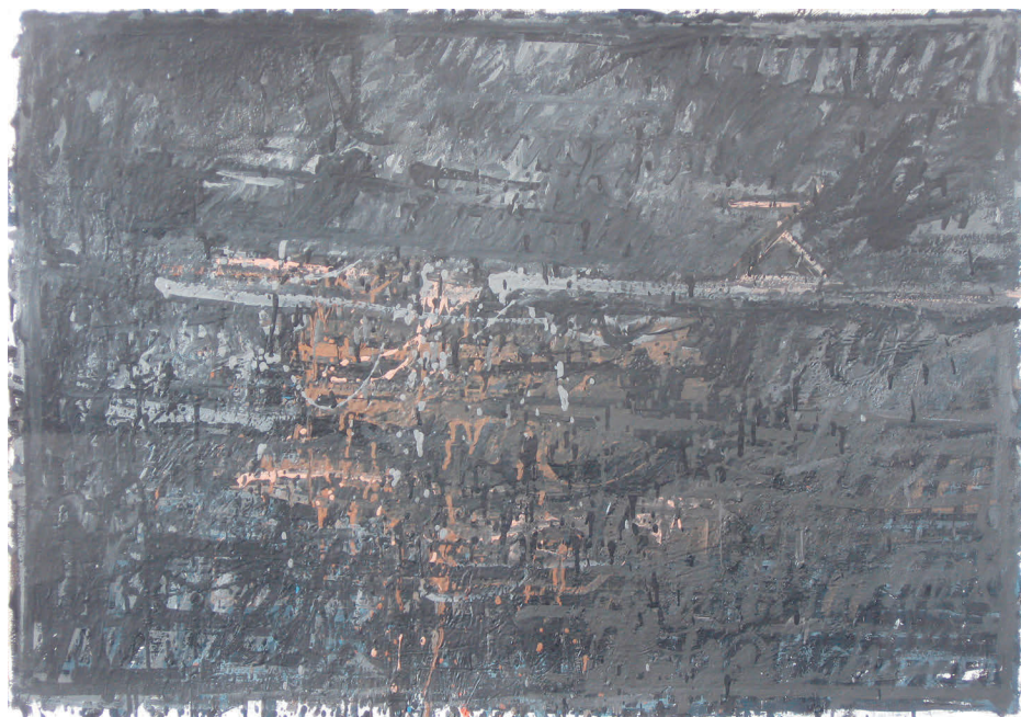
УХТ 2.5.16.13, комбинована техника, 70 x 100 cm