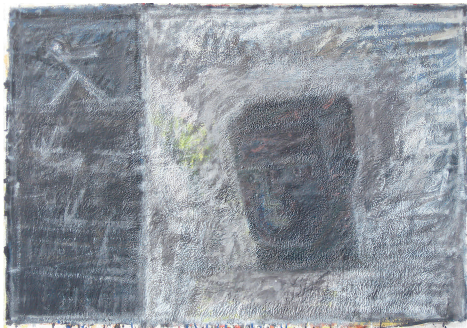
УХПЗ 2.5.16.15, комбинована техника, 70 x 100 cm