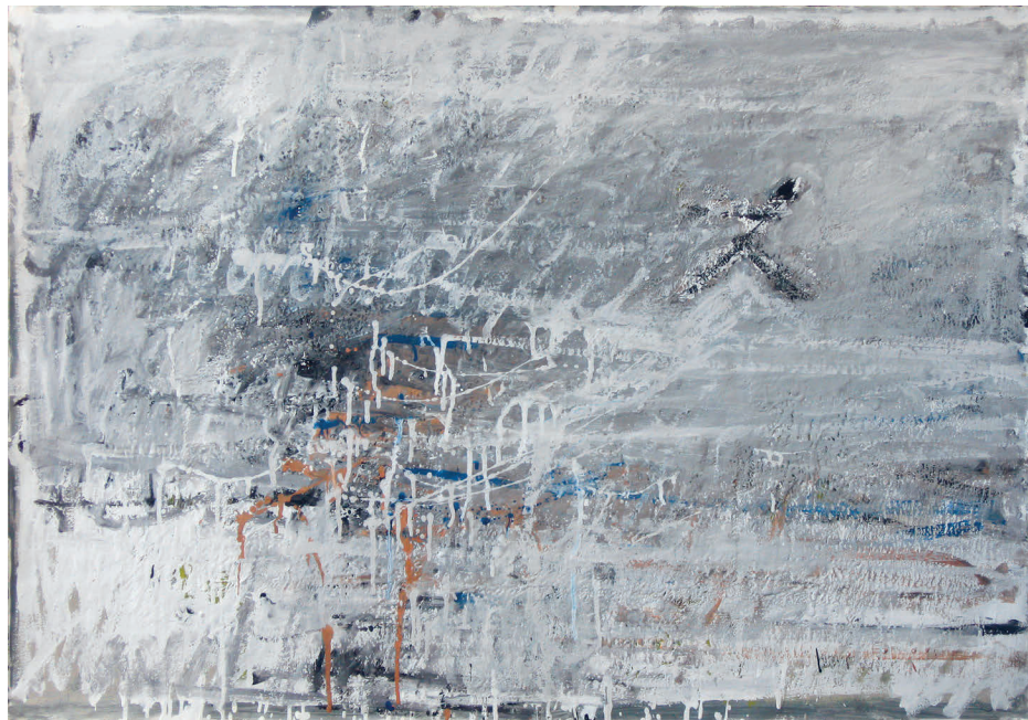
УХТ 2.5.16.12, комбинована техника, 70 x 100 cm