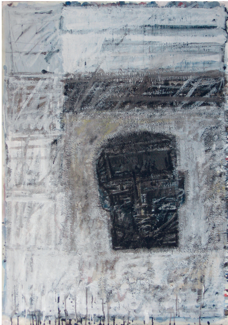
УХПЗ 2.5.16.98, комбинована техника, 70 x 100 cm