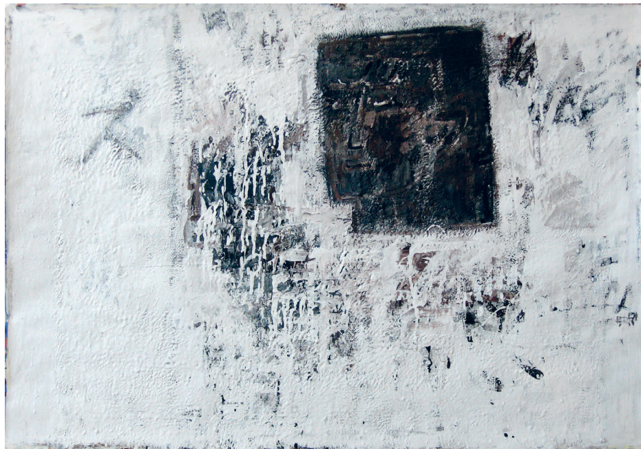
УХП 4.4.16.58, комбинована техника, 70 x 100 cm