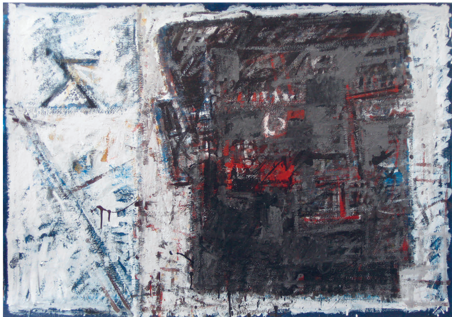
УХПЗ 2.5.16.16, комбинована техника, 70 x 100 см