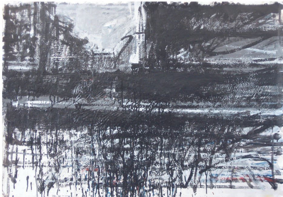
T 2.5.16.910, комбинована техника, 70 x 100 cm