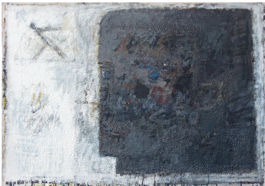
УХПЗ 1.5.16.20, комбинована техника, 70 x 100 см