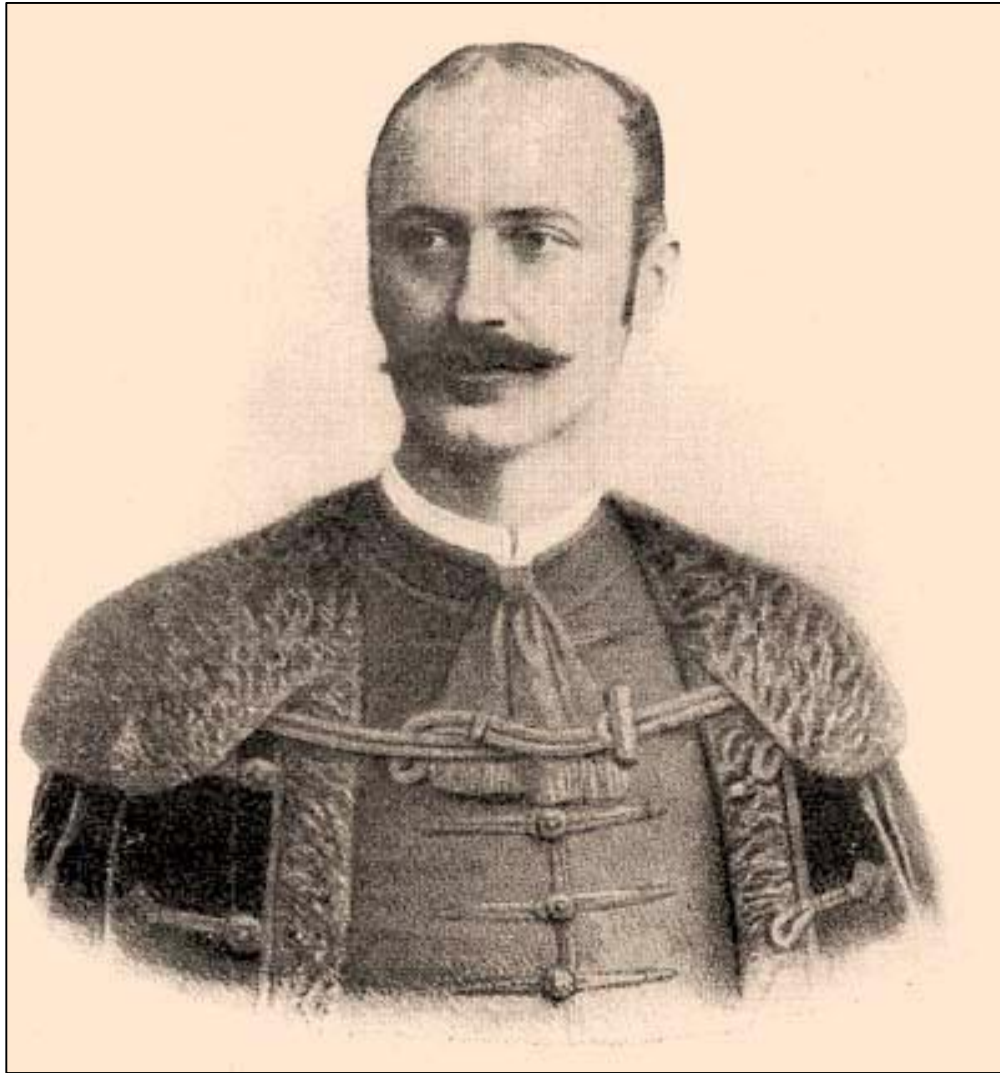
Торонталски велики жупан Јене Ронаи У публикацији: Borovszky Samu, Torontál vármegye , Budapest 1911.