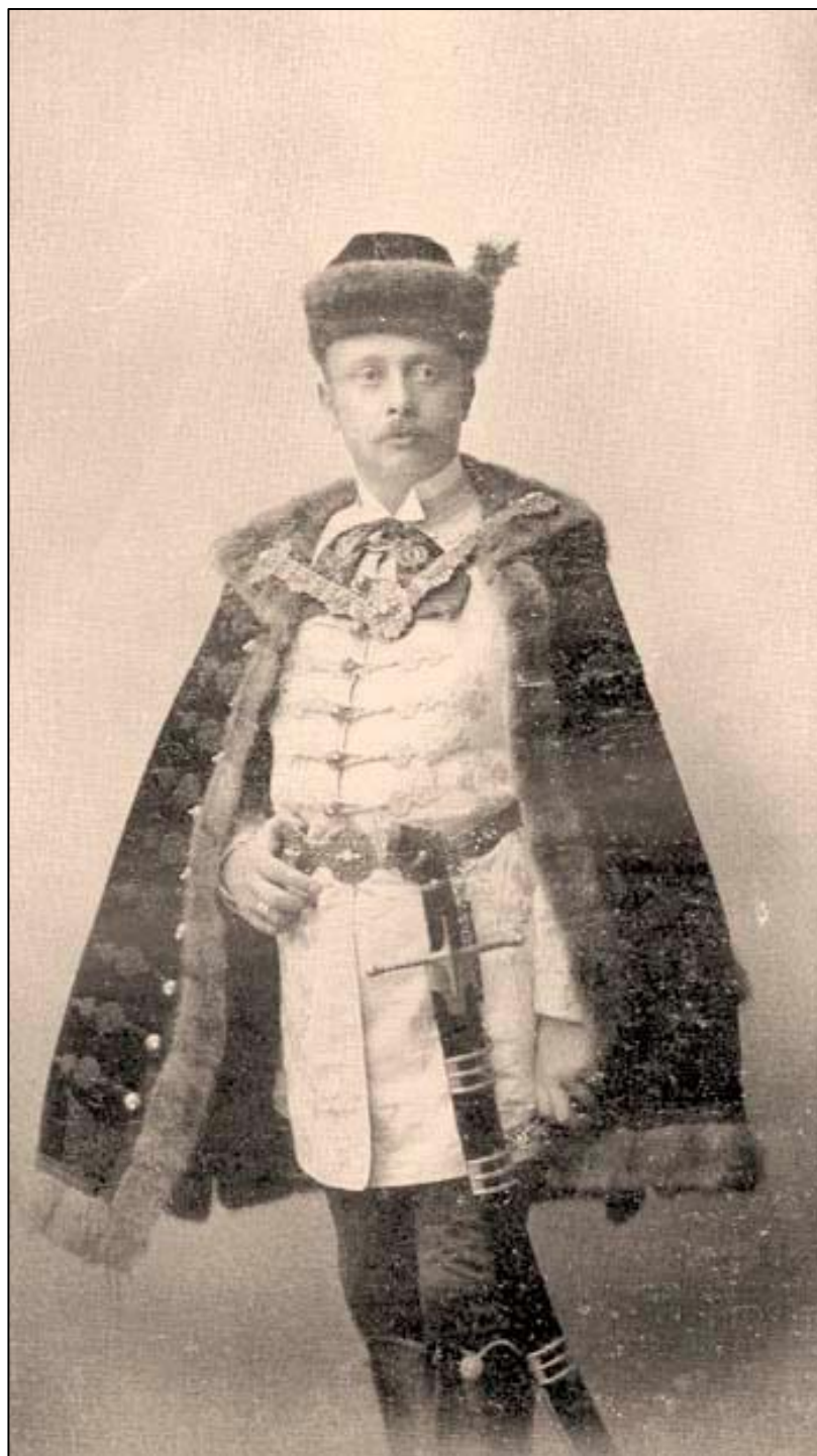
Торонталски велики жупан Лајош Делиманић У публикацији: Borovszky Samu, Torontál vármegye , Budapest 1911.