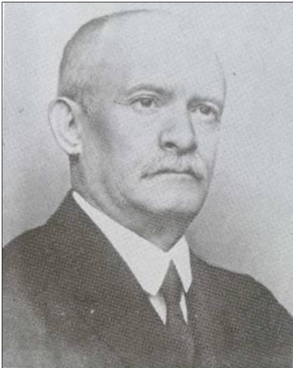
Торонталски велики жупан Берђ Штојер (фотографија из каснијег периода)