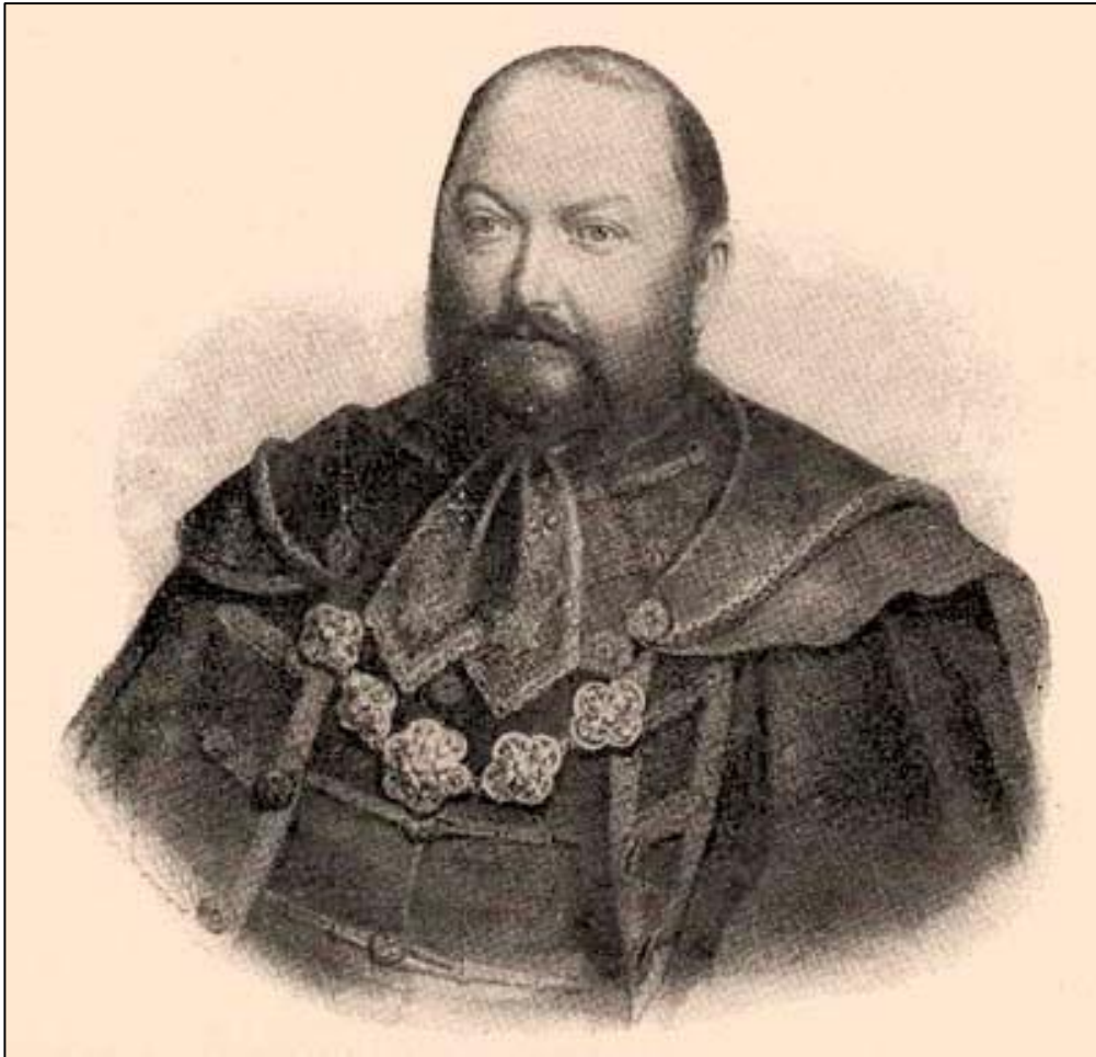
Торонталски велики жупан Јожеф Хертеленди У публикацији: Borovszky Samu, Torontál vármegye , Budapest 1911.