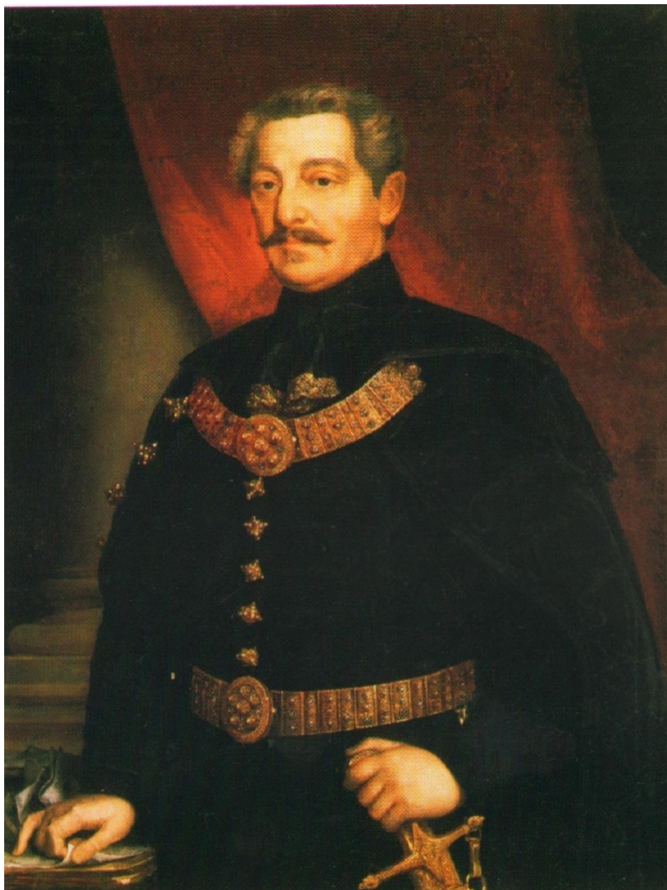
Миклош Барабаш Портрет торонталског великог жупана Ласла Карачоњија (1861) Уље на платну, 110 x 84 cm, инв. број: 67.34.1 Музеј „Атила Јожеф”, Мако