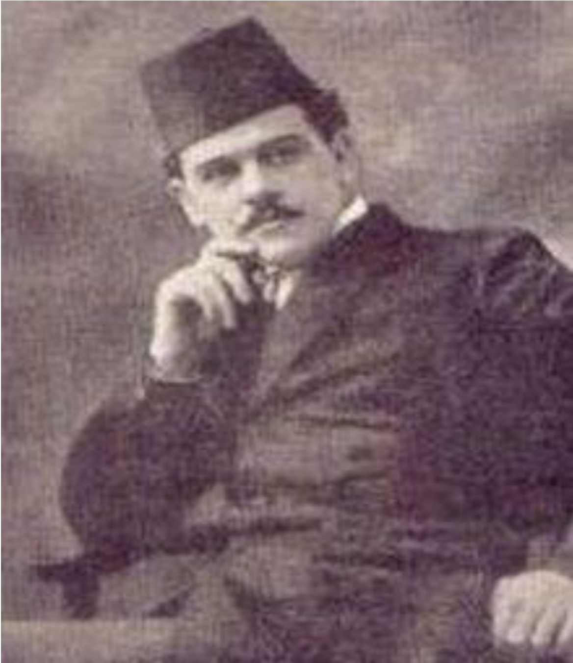
11. Осман Ђикић

(извор: https://en.wikipedia.org/wiki/Osman_Đikić )