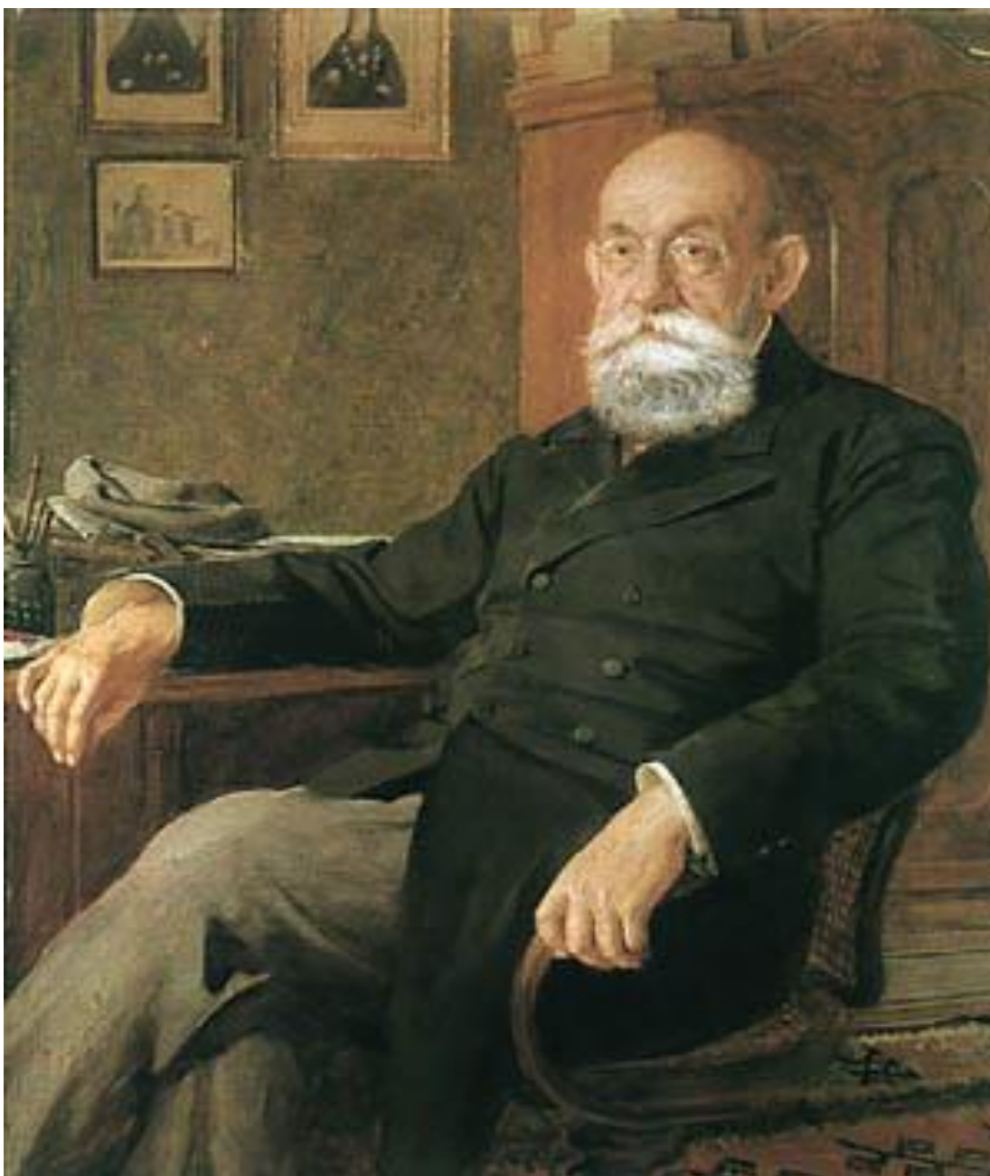
7. Стојан Новаковић (уље на платну Уроша Предића)