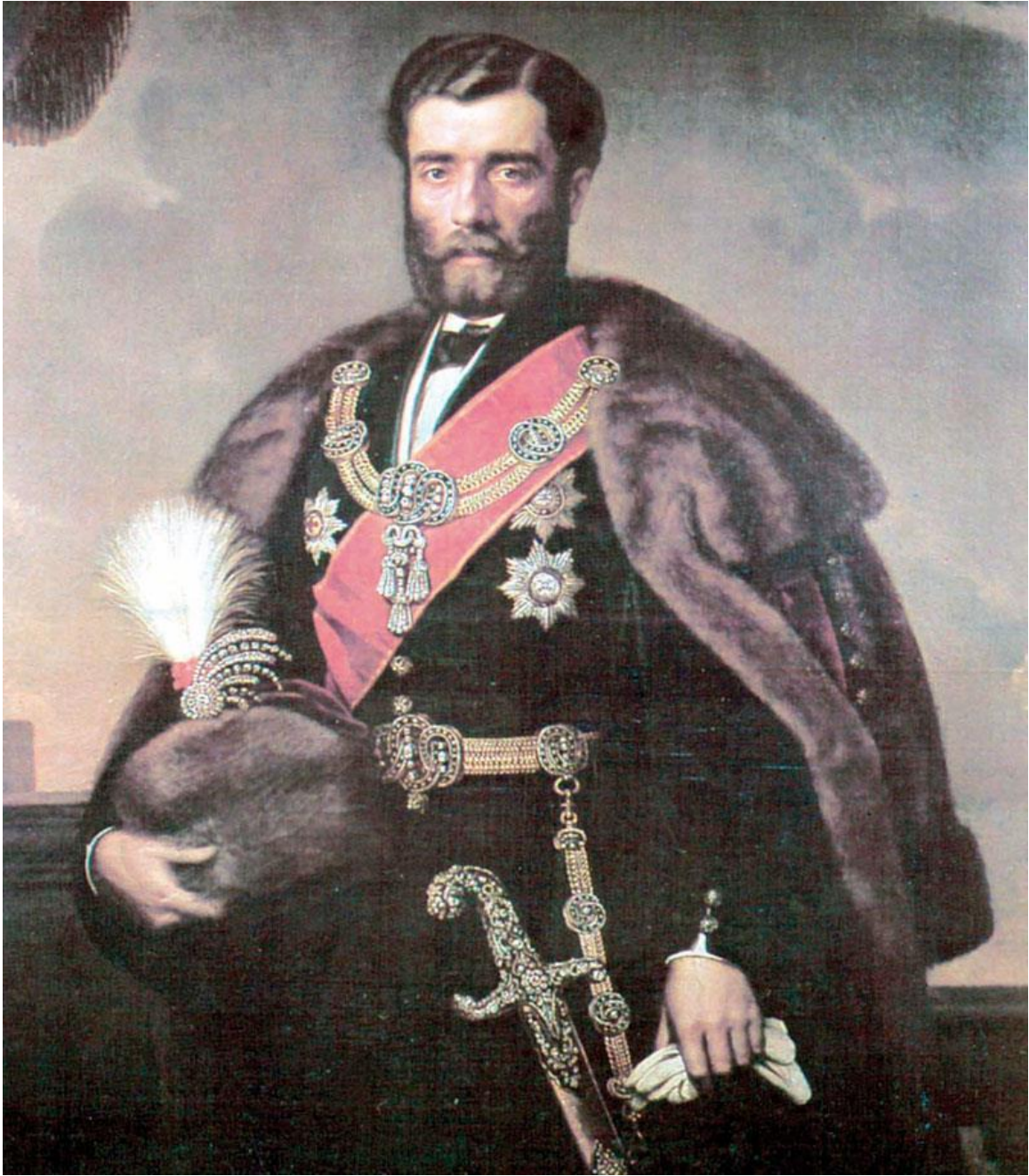
4. Кнез Михаило Обреновић (уље на платну Јохана Беса)