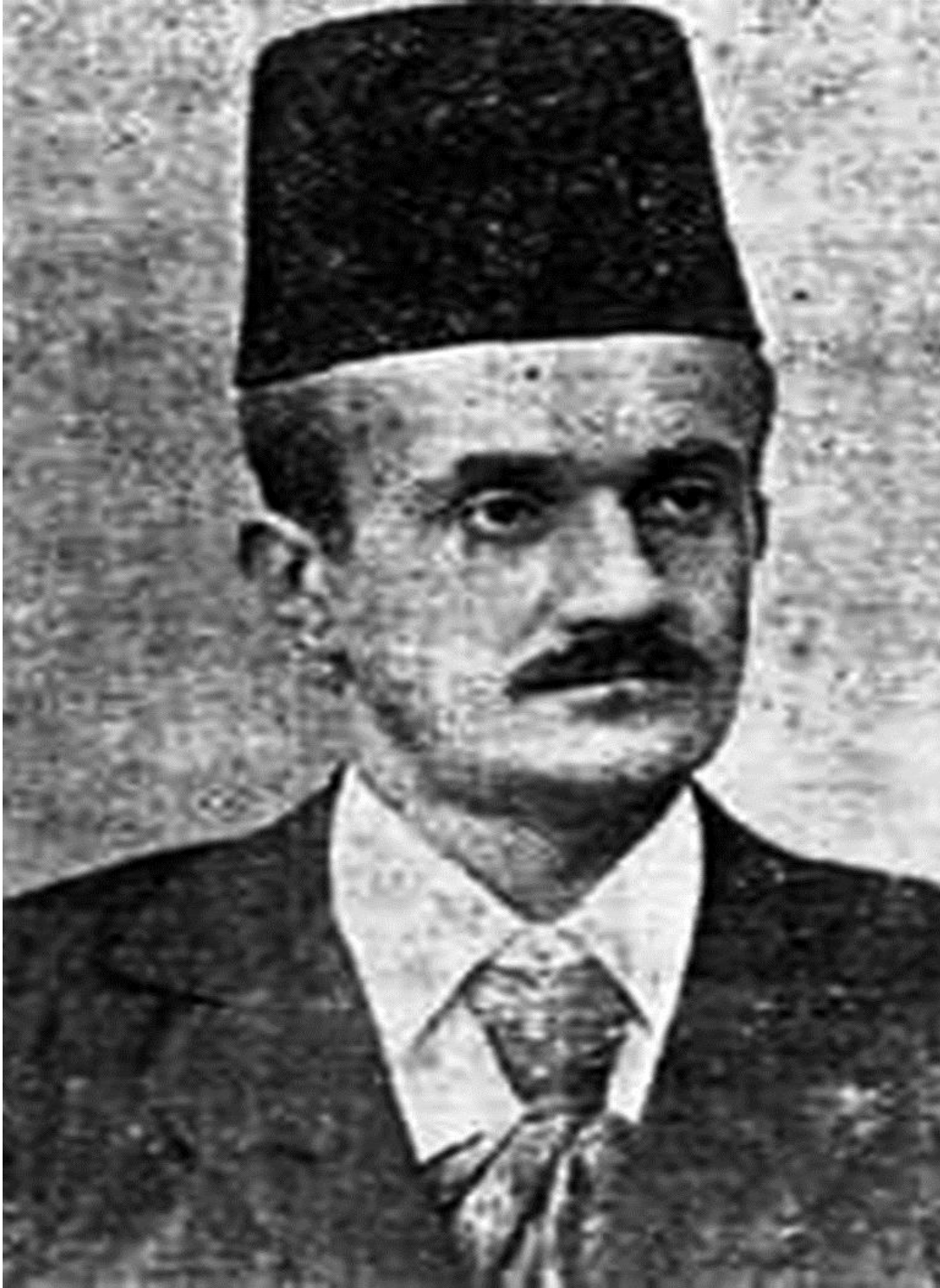
13. Омер-бег Сулејманпашећ Скопљак (Деспотовић)