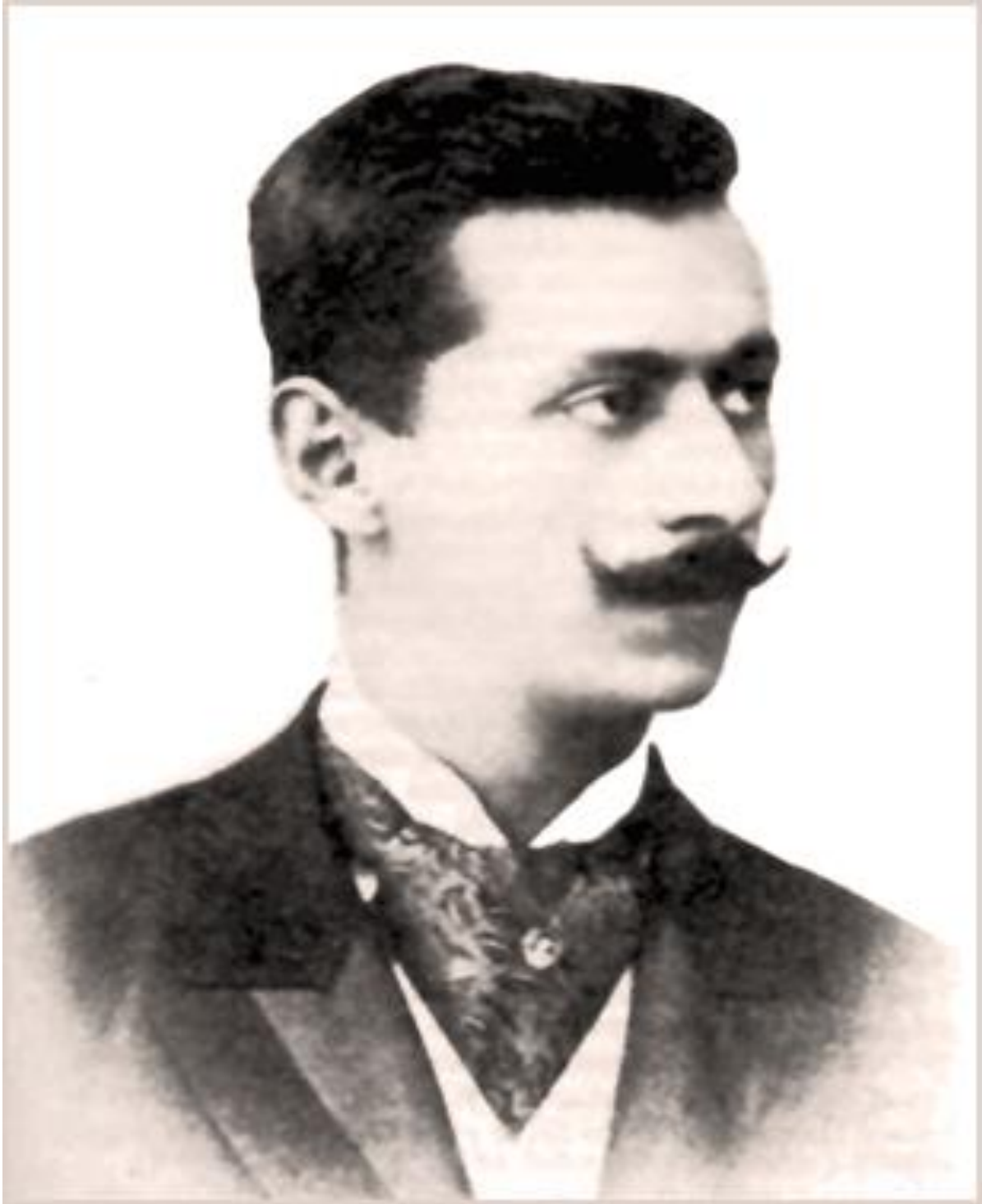
10. Јован Дучић