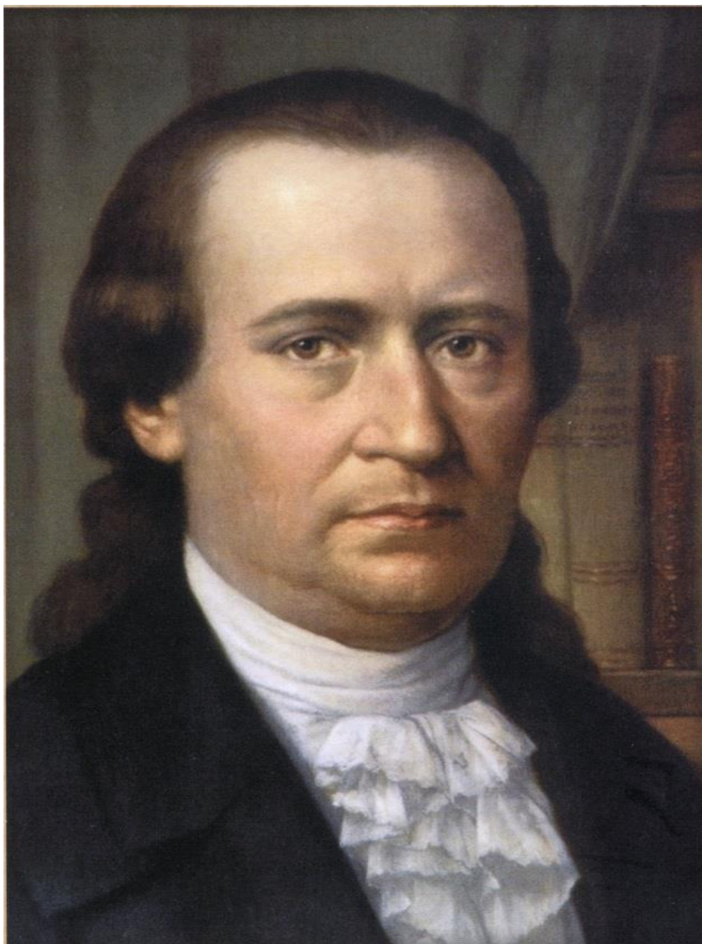
2. Доситеј Обрадовић (Портрет Доситеја Обрадовића, рад Уроша Предића)