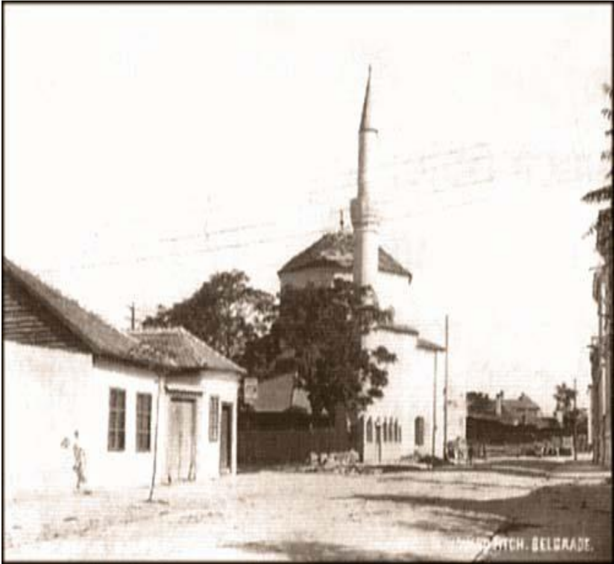
5. Бајракли џамија у Београду 1912.

(разгледнице старог Београда, извор: www.staribeograd.com )