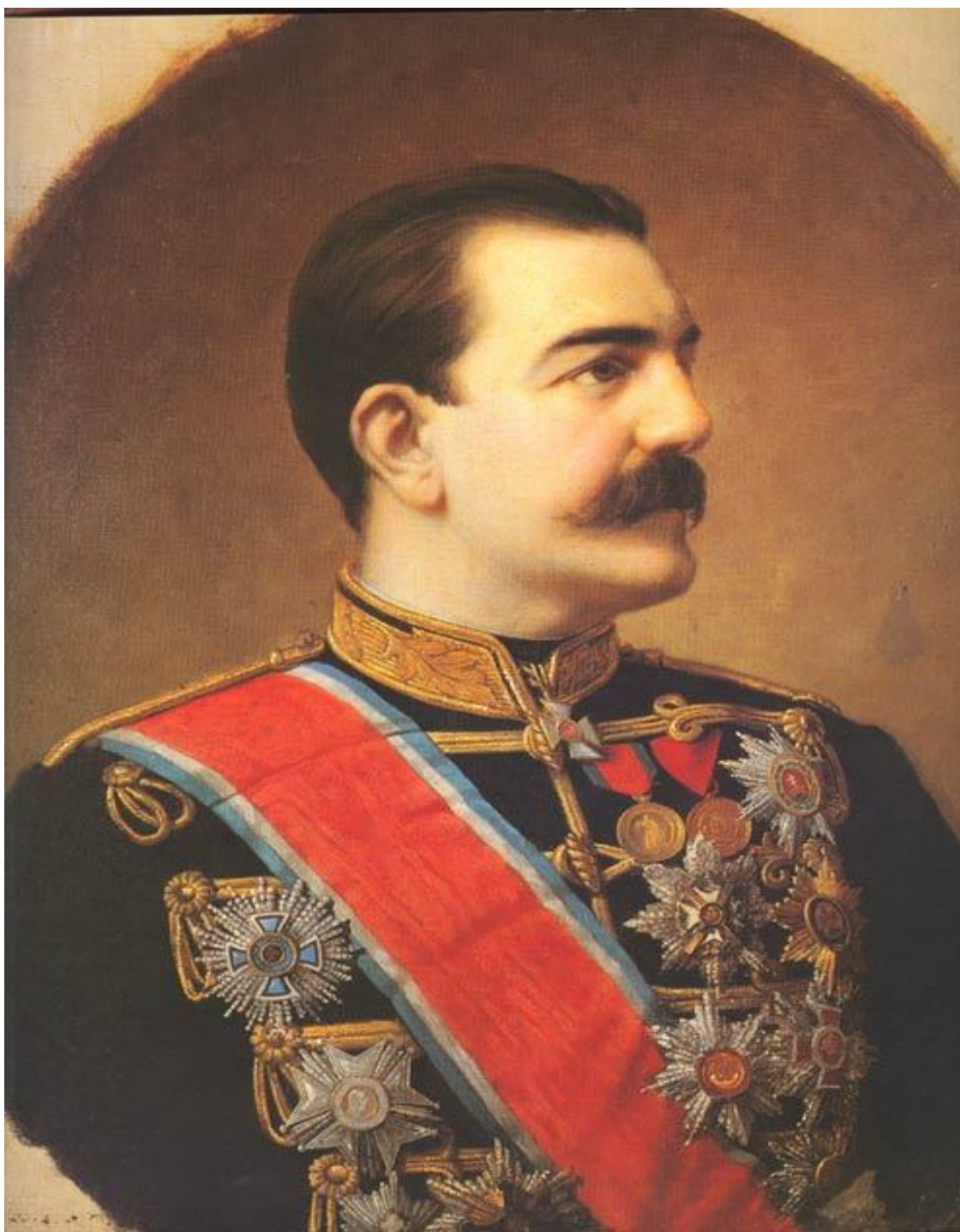
6. Српски краљ Милан Обреновић (уље на платну сликара Стеве Тодоровића, 1881)