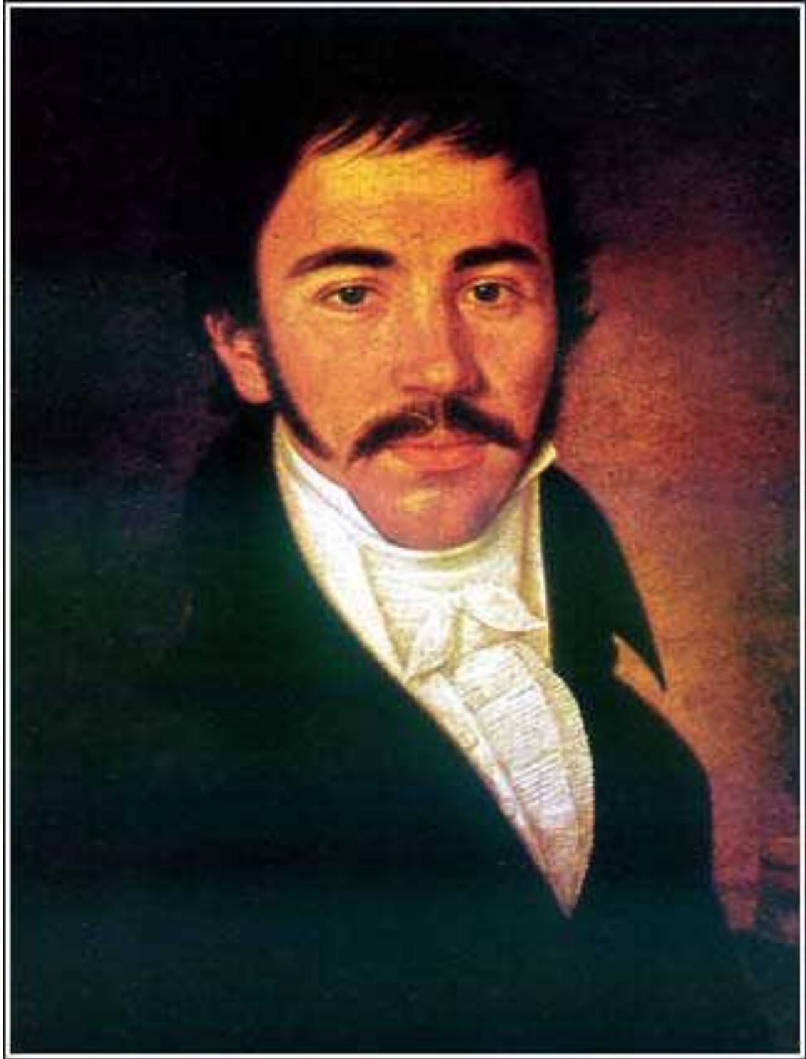
3. Вук Караџић (уље на платну Павела Ђурковића, 1816)