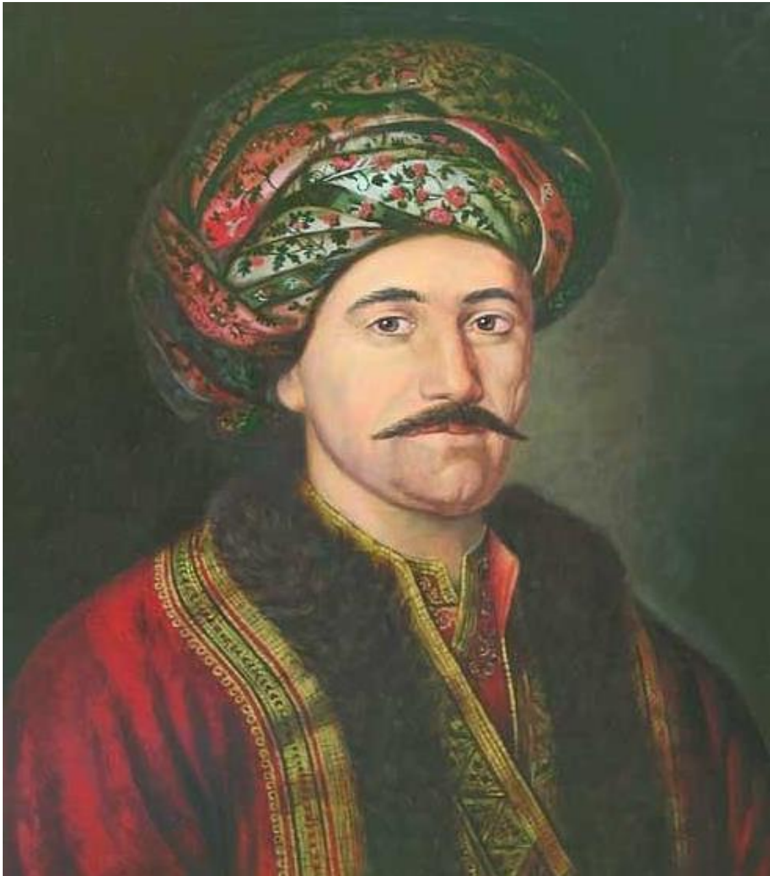
1. Кнез Милош Обреновић (уље на платну Павела Ђурковића, 1824)