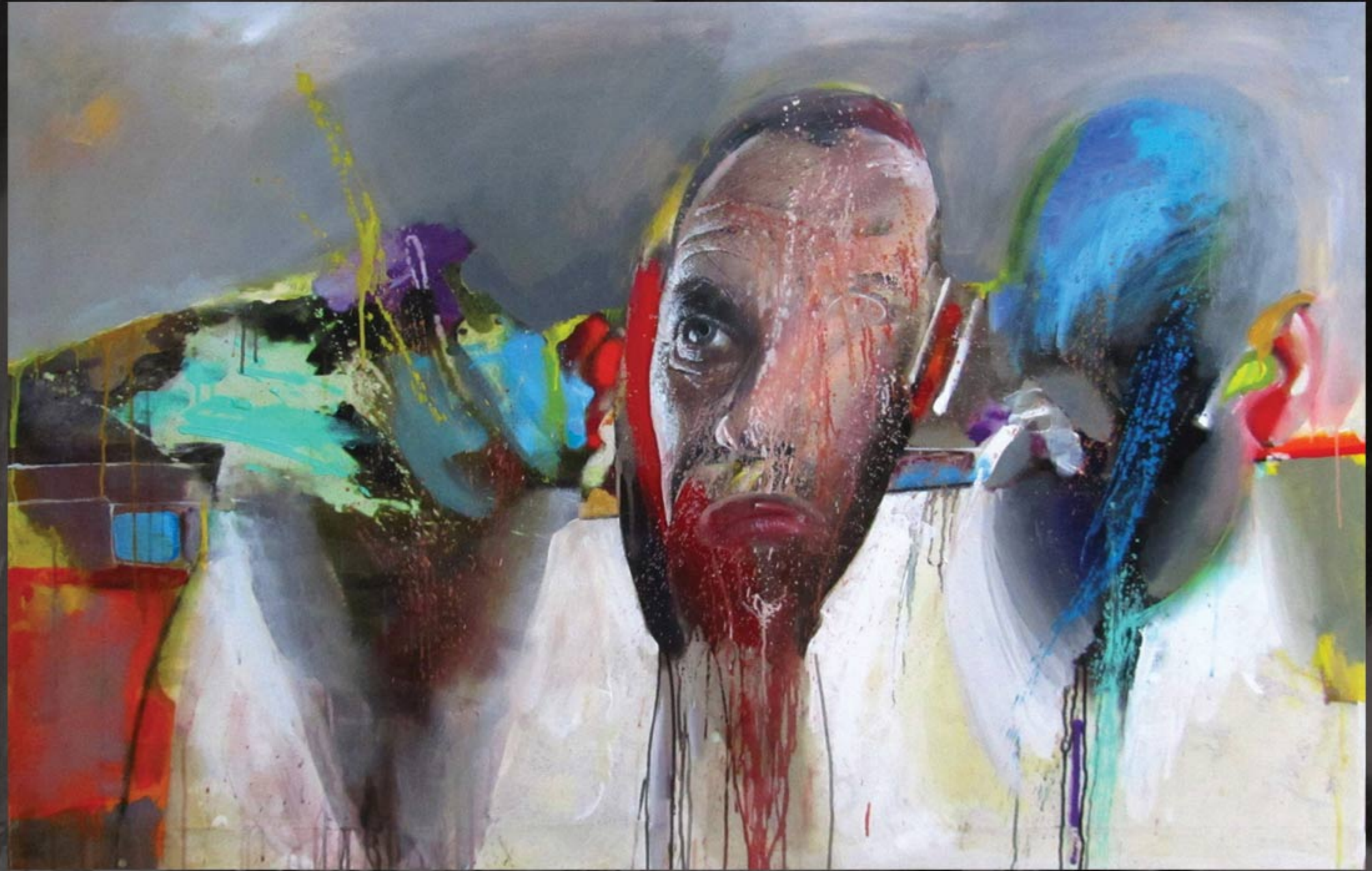
"Lica i naličja 1", ulje na platnu, 150 x 100cm, 2013 god.