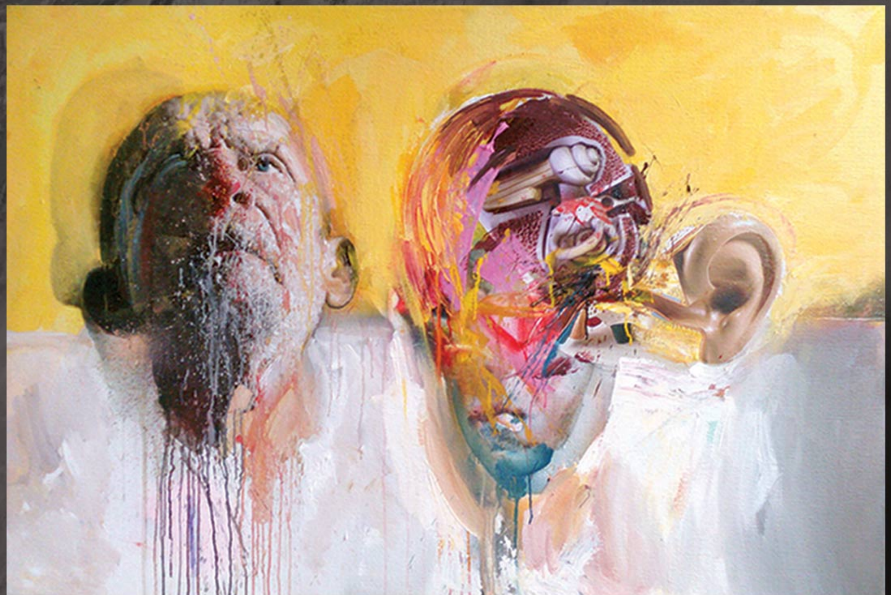
"Lica i naličja 2", ulje na platnu, 150 x 100cm, 2013 god.

www.kusmuk.net markokusmuk@yahoo.com +381 65 5132645