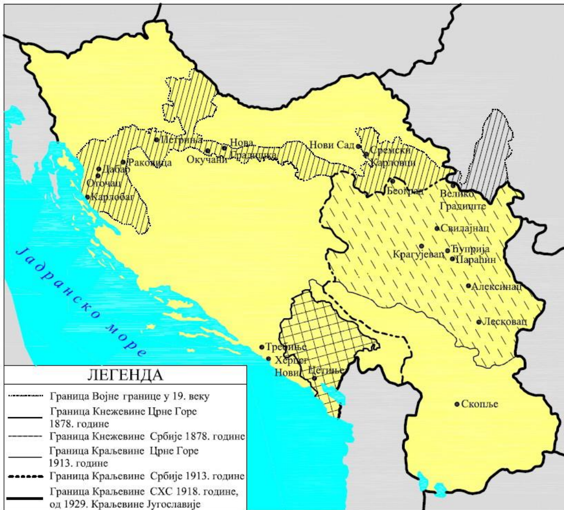
Прилог 1: Карта кретања Стеве Чутурила.