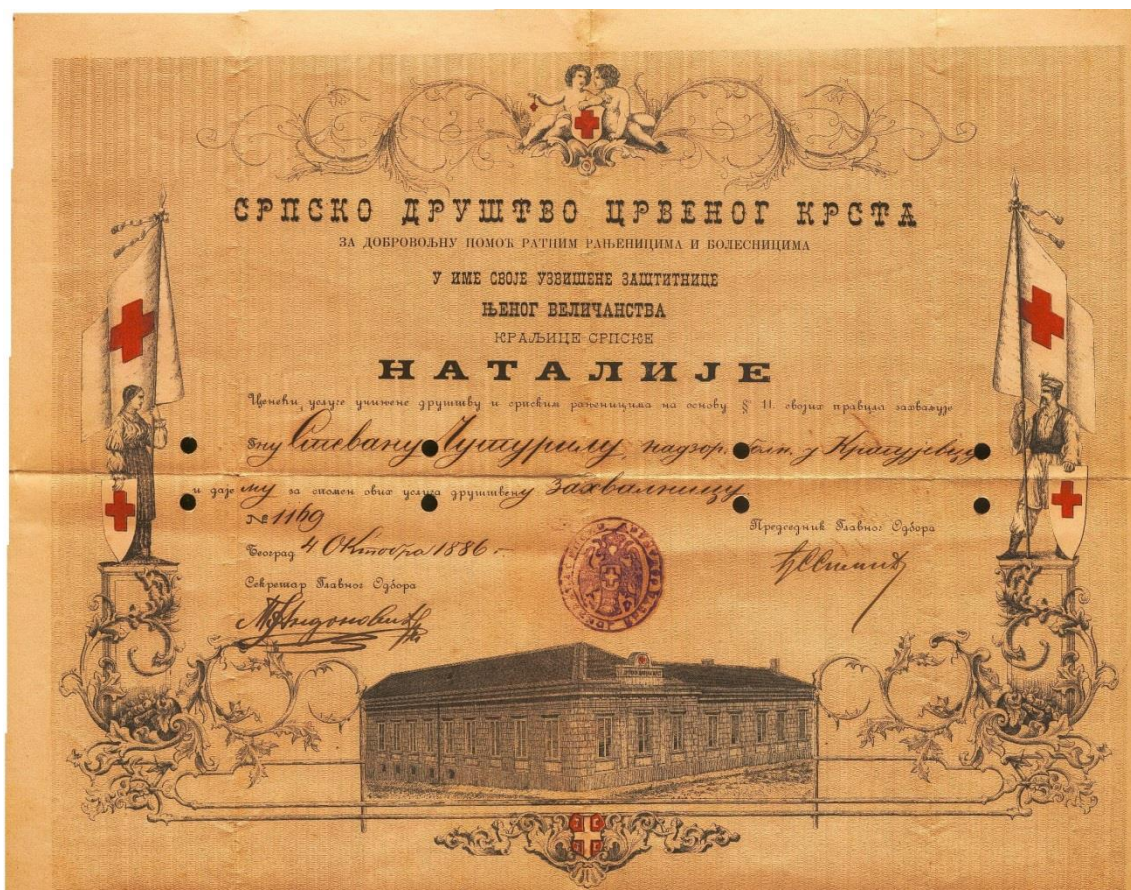
Прилог 12: Захвалница, Београд, 1886.