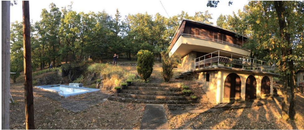
Kuća na Avali

Nakon ovog inicijalnog razočaranja, angažovali smo nekoliko osoba koje su se dale u potragu za adekvatnim vikendicama po čitavoj Srbiji. Razmatrali smo i opcije da umesto proplanka završnu scenu snimamo na reci, jezeru, nekoj vrsti obale, ali smo i od toga odustali, jer bi to značilo preveliko odstupanje od koncepta i samog scenarija, i donosilo dominantno utisak melanholijske i sete, a ne životne energije i borbe sa prirodom, odnosno samim sobom.