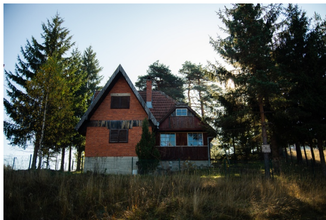
Odabrana lokacija za scenu dolaska u vikendicu – Zlatibor

Otvarajući sva ta pitanja u razgovorima koje su naše junakinje vodile u kolima, jasno je bilo da će gledalac u svojoj glavi imati ova pitanja i da će tražiti svoje odgovore, to jest da će sa punom pažnjom upijati sve informacije koje se budu vizuelno plasirale od trenutka kada starija ćerka Jovana otvori vrata vikendice. Želeli smo da gledaocima jasno komuniciramo da je Otac tu, ali i da živi sam u tom prostoru, a da je u trenutku njihovog dolaska izašao iz kuće. Verovatno je želeo da dođe sebi, jer njihov dolazak nije bio najavljen i za njega predstavlja ozbiljno iznenađenje. Ocu je ipak bilo potrebno vreme da se „sabere“ i da na dobar način pristupi ponovnom okupljanju porodice i svim pitanjima koja će se tom prilikom otvoriti. To je njegova prva, impulsivna reakcija, ali i nešto što nama omogućava da se vratimo ponovo u centar priče, a to je pogled ćerki na ugao koji zauzima njihova majka, na njene životne odluke.