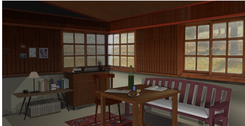
Scenografiska skica objekta za enterijer kuće

Otvarajući sva ta pitanja u razgovorima koje su naše junakinje vodile u kolima, jasno je bilo da će gledalac u svojoj glavi imati ova pitanja i da će tražiti svoje odgovore, to jest da će sa punom pažnjom upijati sve informacije koje se budu vizuelno plasirale od trenutka kada starija ćerka Jovana otvori vrata vikendice. Želeli smo da gledaocima jasno komuniciramo da je Otac tu, ali i da živi sam u tom prostoru, a da je u trenutku njihovog dolaska izašao iz kuće. Verovatno je želeo da dođe sebi, jer njihov dolazak nije bio najavljen i za njega predstavlja ozbiljno iznenađenje. Ocu je ipak bilo potrebno vreme da se „sabere“ i da na dobar način pristupi ponovnom okupljanju porodice i svim pitanjima koja će se tom prilikom otvoriti. To je njegova prva, impulsivna reakcija, ali i nešto što nama omogućava da se vratimo ponovo u centar priče, a to je pogled ćerki na ugao koji zauzima njihova majka, na njene životne odluke.