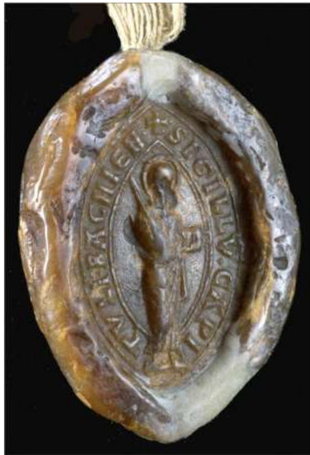
Slika 1. Pečat bačkog kaptola na prvoj poznatoj povelji iz 1229. godine 2509