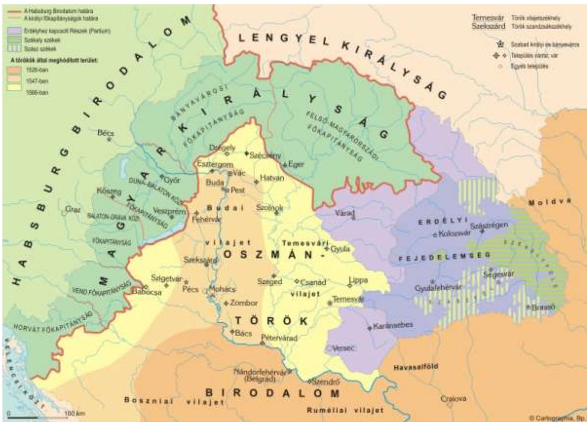
Karta 7. Osmanska osvajanja u Ugarskoj i organizovanje Budimskog i Temišvarskog elajeta 2504