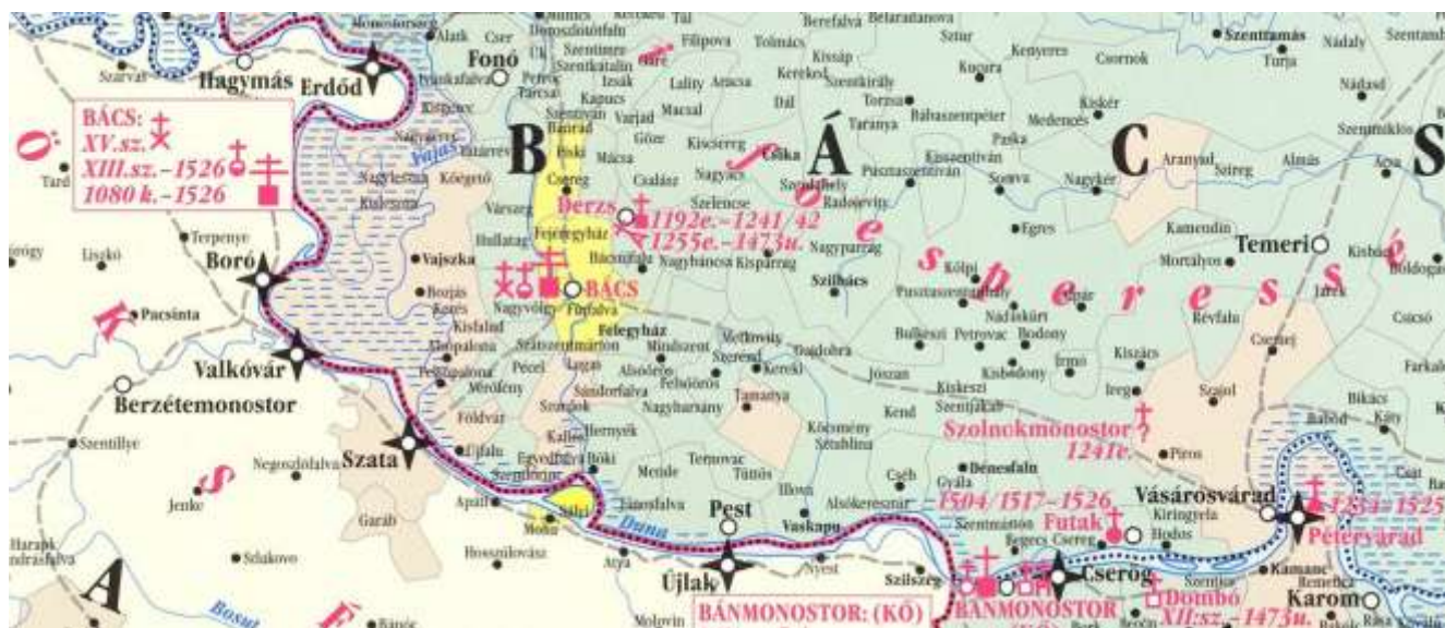
Karta 4. Bač i njegova okolina sa posedima Bačkog kaptola (označeni sa žutom bojom) 2502