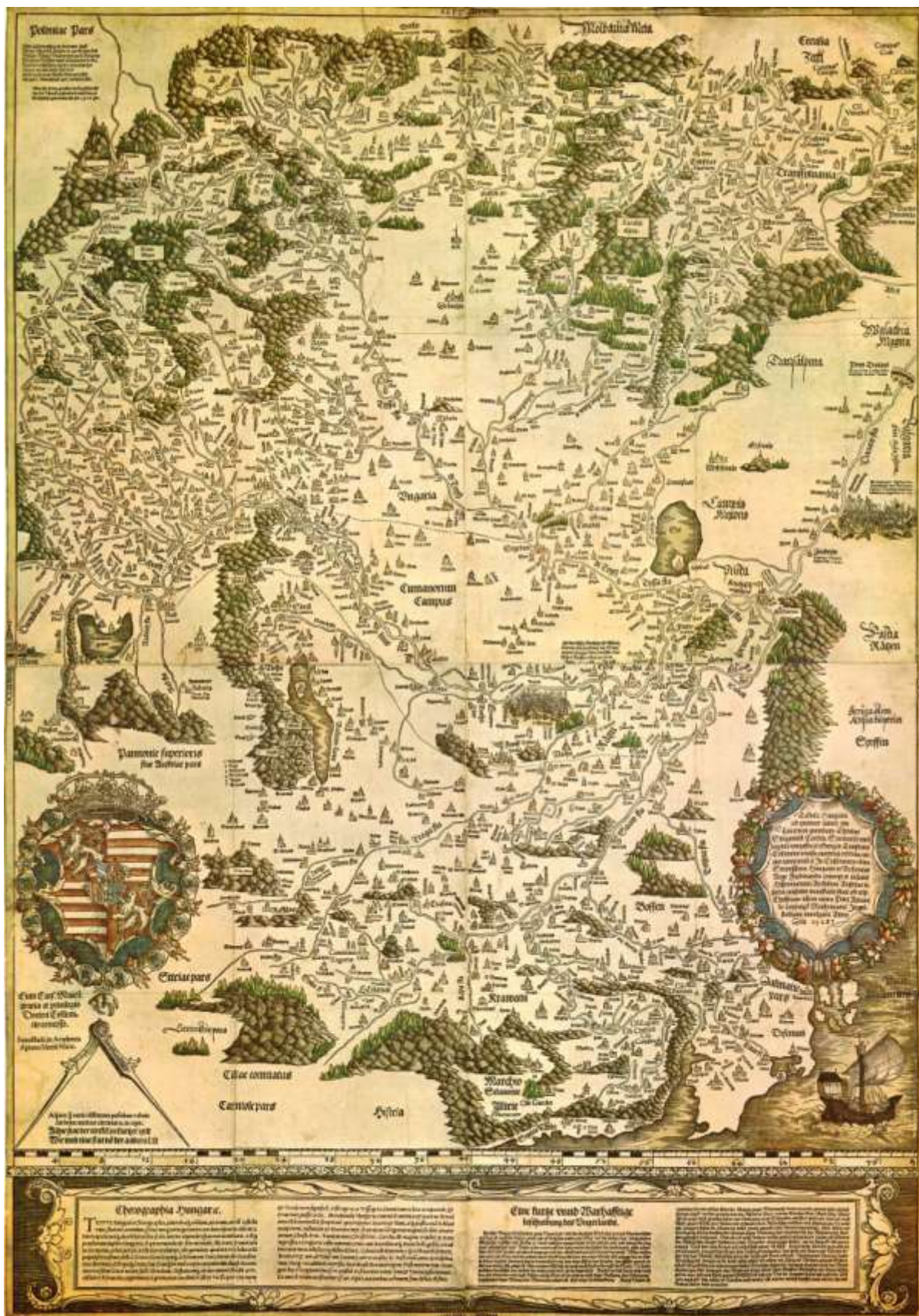
Karta 3. Lazarova karta Ugarske iz 1528. godine 2503