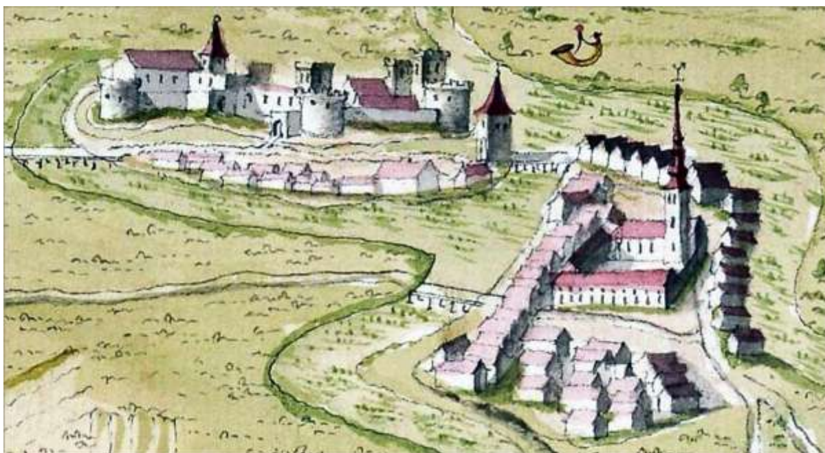
Slika 2. Bač i bačka tvrđava na crtežu topografa F. N. Spara de Bensdorfa 1697. godine 2510