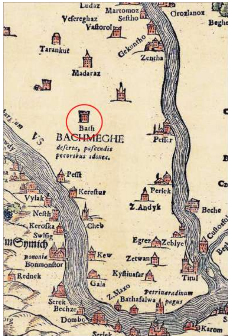
Karta 9. Bača i okolina na Lacijusovoj karti 2506