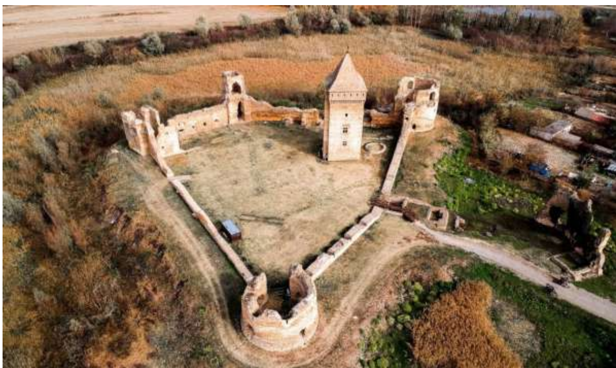
Slika 3. Bačka tvrđava 2511