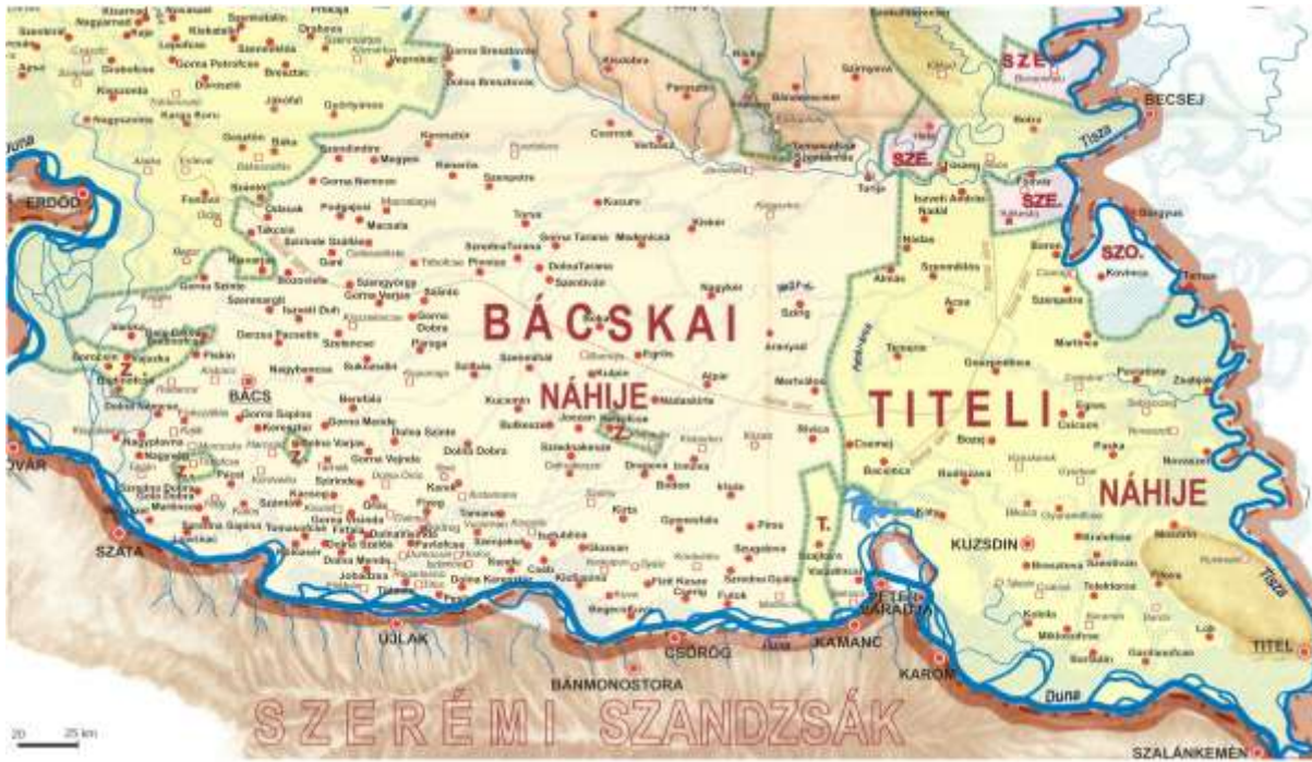
Karta 11. Bačka nahija 1570. godine 2508