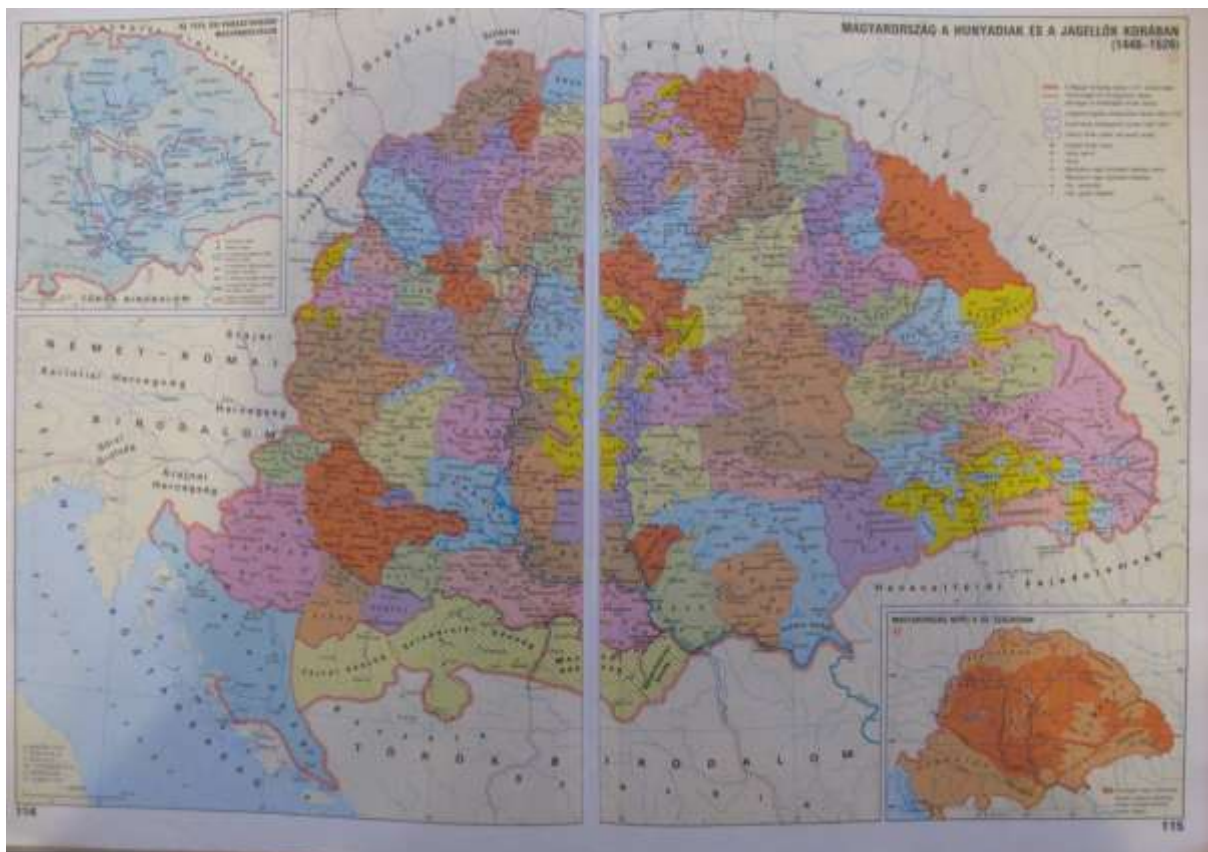
Karta 1. Ugarska za vreme Hunjadijevaca i Jagelonaca (1440-1526) 2499