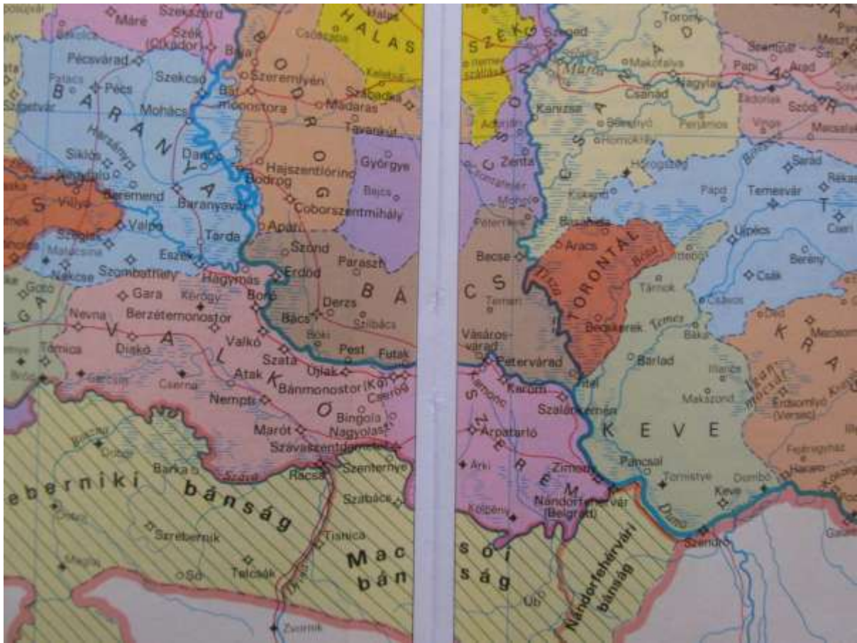
Karta 2. Bačka županija od 1440. do 1526. godine. 2500