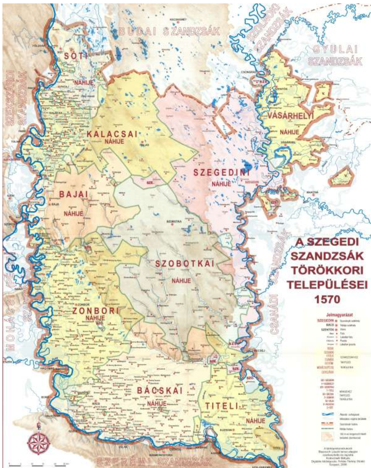
Karta 10. Administrativna podela Segedinskog sandžaka iz 1570. godine 2507