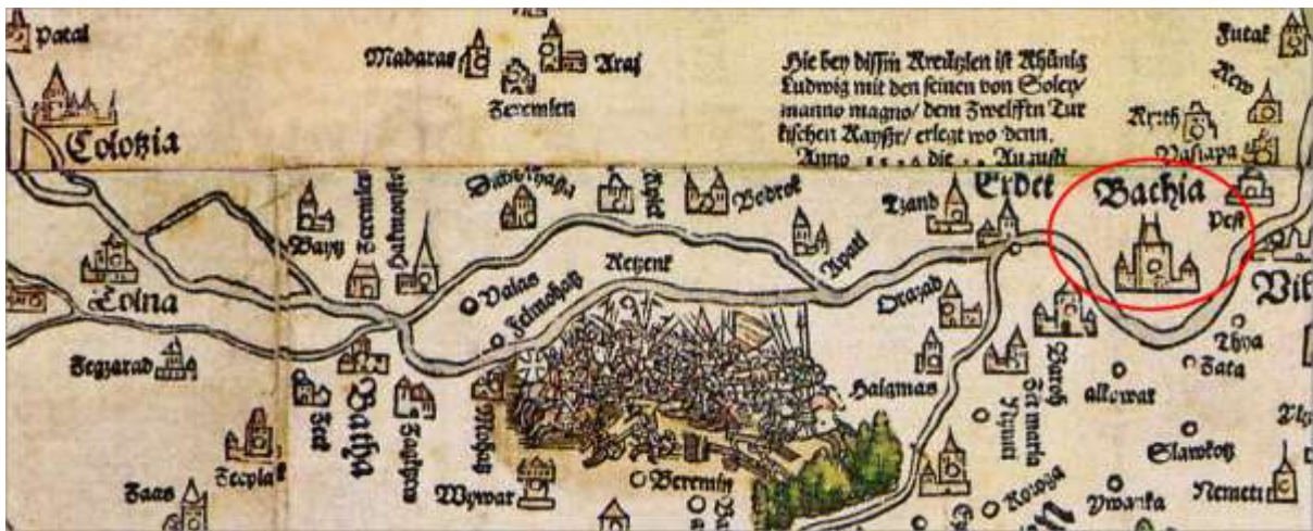
Karta 6. Bač i njegoa okolina na Lazarovoj karti