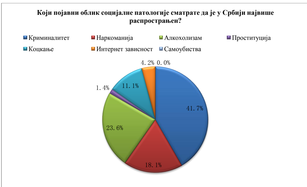
Графикон 1. Приказ процентуалне заступљености одговора свих испитаника обухваћених истраживањем датих на питање: Који појавни облик социјалне патологије сматрате да је у Србији највише распрострањен?

Истовремено, испитивање мишљења стручне јавности по овом питању је значајно имајући у виду да прецизне податке о стварној распрострањености одређених појава готово да није могуће добити због специфичности, комплексности и прикривености самих појавних облика.