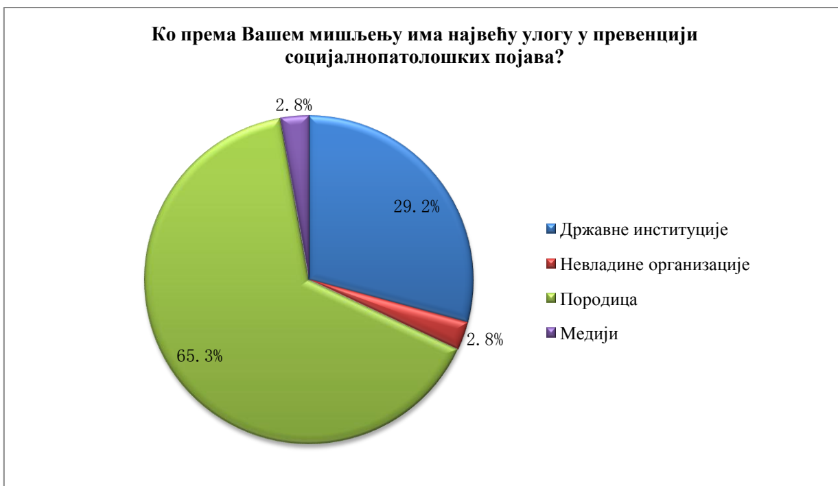
Графикон 6. Приказ процентуалне заступљености одговора свих испитаника обухваћених истраживањем датих на питање: Ко према Вашем мишљењу има највећу улогу у превенцији социјалнопатолошких појава?