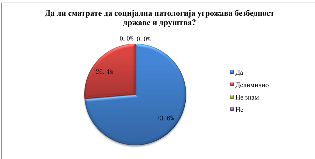
Графикон 2. Приказ процентуалне заступљености одговора свих испитаника обухваћених истраживањем датих на питање: Да ли сматрате да социјална патологија угрожава безбедност државе и друштва?

С обзиром на то да је мишљење свих испитаника, односно учесника у истраживању да социјална патологија угрожава или да делимично угрожава безбедност државе и друштва, јасно је да се и они као чланови тог друштва у већој или мањој мери осећају угрожено.