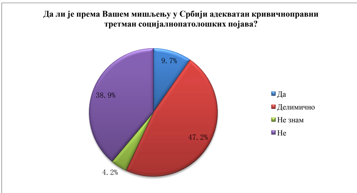
Графикон 4. Приказ процентуалне заступљености одговора свих испитаника обухваћених истраживањем датих на питање: Да ли је према Вашем мишљењу у Србији адекватан кривичноправни третман социјалнопатолошких појава?