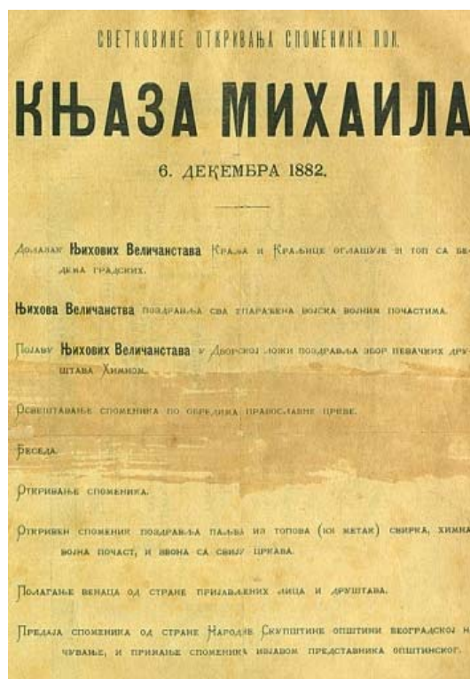
Програм откривања споменика књазу Михајлу Обреновићу

Новаковић уздиже кнеза Михаила као стратега напретка Србије и у многим другим областима јавног, економског, политичког и културног живота. Међутим, оно што је за њега била тековина од пресудне важности јесте да је овај владалац утро пут српској државној и националној независности.