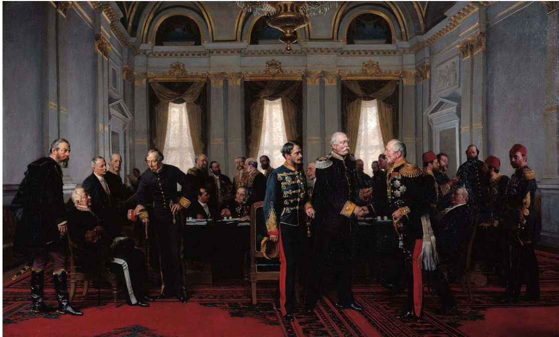
Слика Антона фон Вернера Берлински конгрес

( https://sh.wikipedia.org/wiki/Berlinski_kongres#/media/File:Berliner_kongress.jpg )