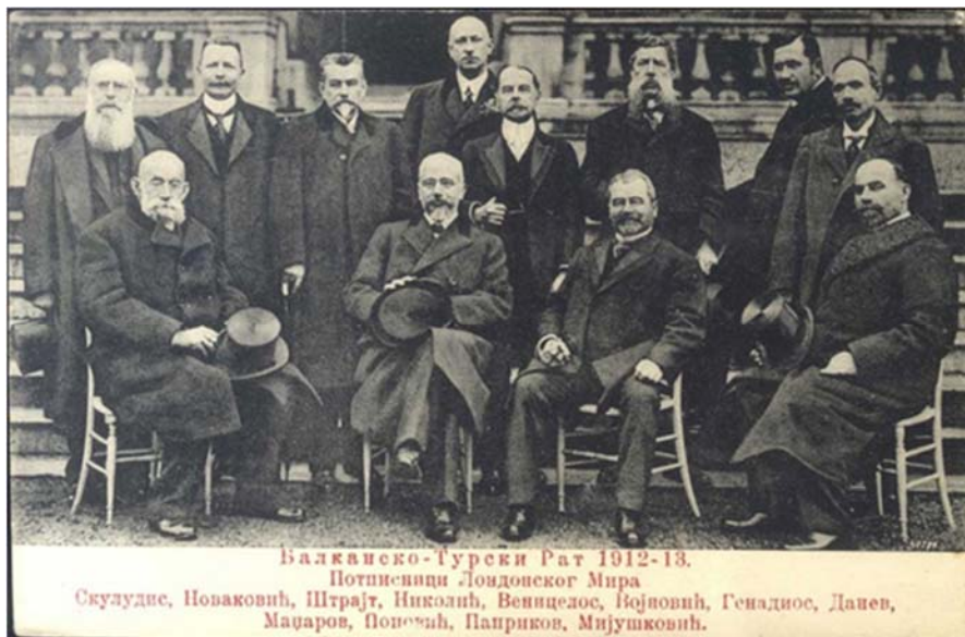
Потписници Лондонског мира

Одлукама Лондонске конференције избегнут је европски рат, али не и сукоби међу балканским савезницима око разграничења у области Македоније. Македонију је ослободила српска војска и по мировним одредбама, Србији је припао већи део Вардарске Македоније. Бугари су захтевали простор између Криве Паланке и Охридског језера који би им омогућио територијални додир са Албанијом и пресекао српско-грчку границу. Истовремено, уследио је грчко-бугарски спор око југоистичних области и, посебно, око Солуна који су Бугари сматрали вратима западне Македоније.