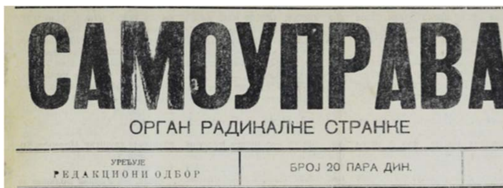
Заглавље листа Самоуправа

Почетак рада Радикалне странке означен је појавом партијског листа Самоуправа у чијем је првом броју објављен програм странке. 18 Посебно утицајни у странци били су Никола Пашић, председник странке и Пера Тодоровић 19 , новинар и аутор програма странке. Радикална странка је представљала велику снагу и значајан фактор у политичком животу Србије осамдесетих година и касније. 20 У спољној политици радикали су сматрали да треба радити на ослобађању и уједињавању Српства, формирању савеза балканских народа, културно помагати још неослобођене делове српског народа и успостављати братске односе са Бугарима.