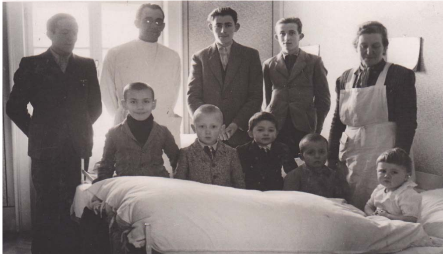
Мушко одељење Дечје болнице у Новом Саду, 1943.