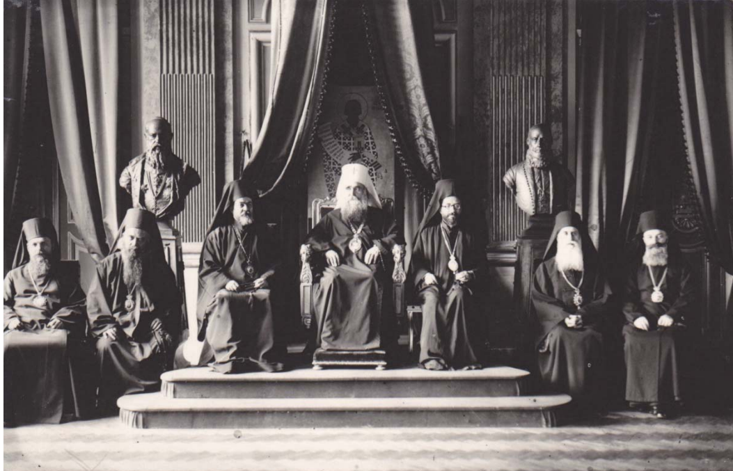
Патријарх Варнава са архијерејима (епископ Иринеј седи други са десне стране), Сремски Карловци, око 1935.

удружења. Највећу пажњу привукао је велики жупан града Суботице, као и неколико изасланстава из тог града, којима је пошло за руком да, поред великог невремена, стигну у Нови Сад и поздраве новог епископа.