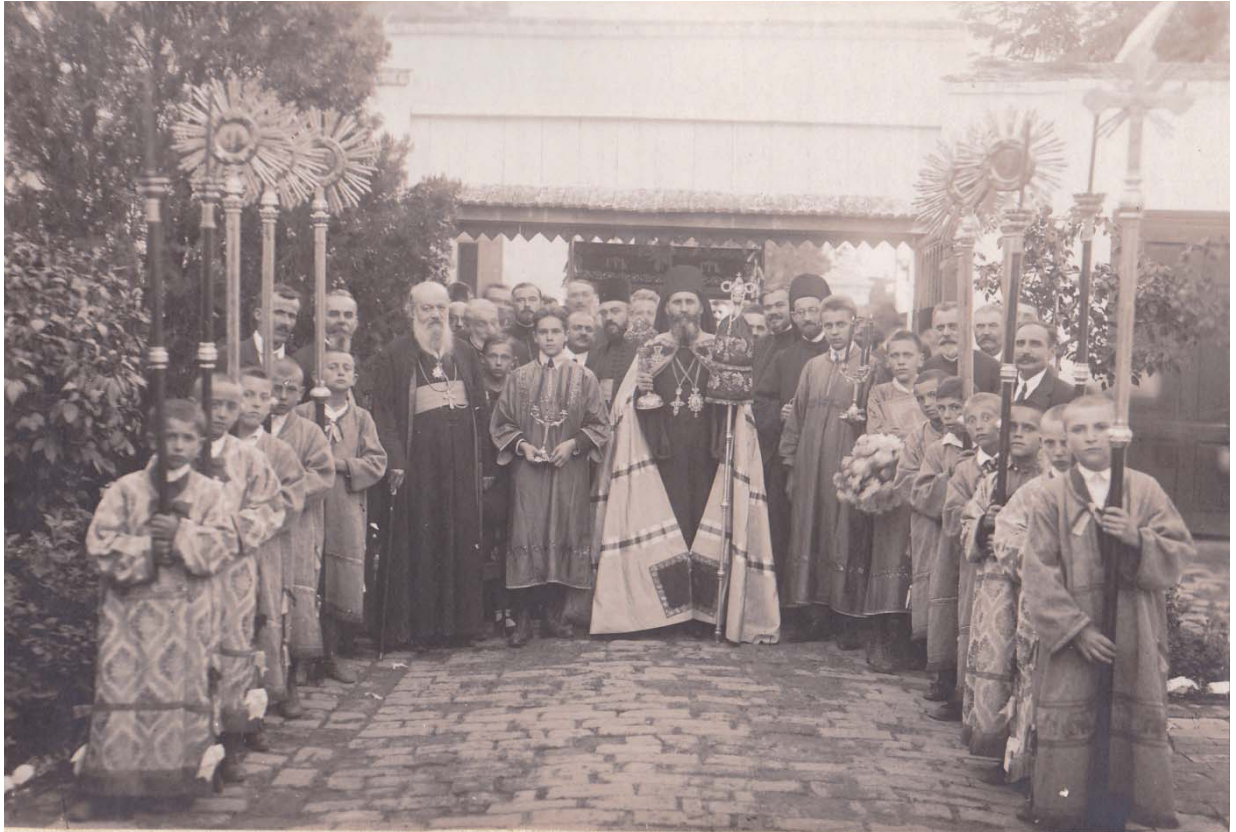
Прота Милан Ћирић и епископ бачки Иринеј у Мољу, 1924.