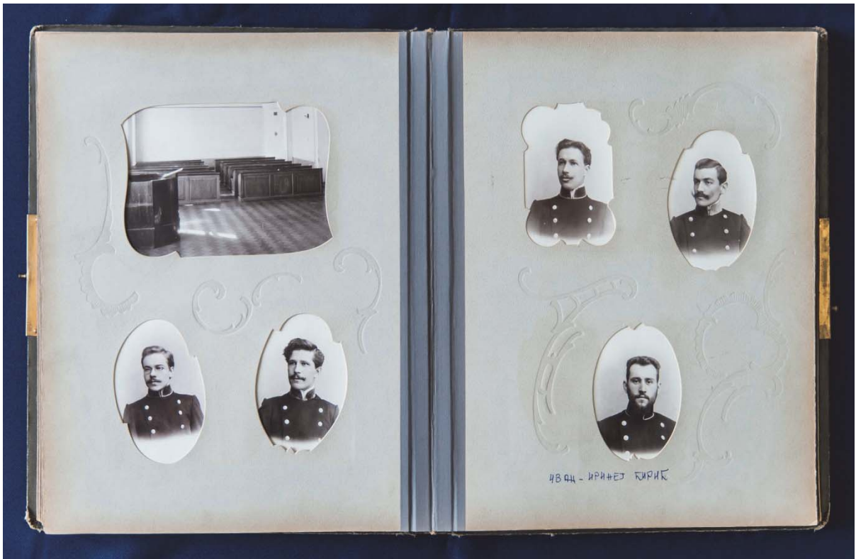
Албум са фотографијама студената Духовне академије, око 1906.