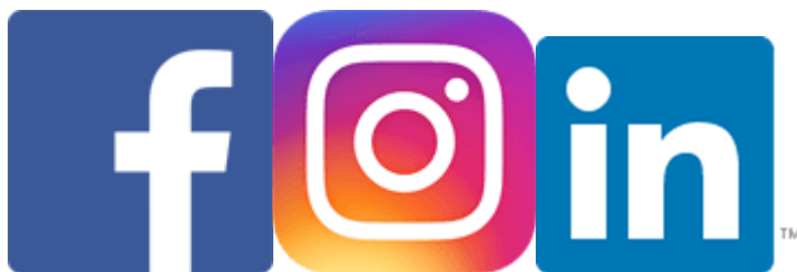
Slika 1. Simboli za Fejsbuk, Instagram i LinkedIn